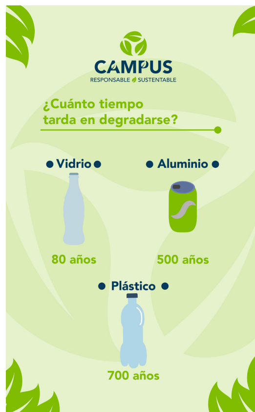
Figura 6. Vista lateral derecha del S3R.

Vista lateral derecha: En el conjunto de esta vista se incluyó nuevamente la identificación del programa Campus Responsable, Campus Sustentable , así como el símbolo del reciclaje. Con el objetivo de proporcionar al usuario información acerca de las consecuencias de la mala disposición de residuos reciclables, utilizando la pregunta ¿Cuánto tiempo tarda en degradarse? , se incluye en la parte inferior información sobre el tiempo de degradación de cada uno de los residuos a recolectar. La vista lateral derecha, en contexto, está adecuada para la conciencia del medio ambiente, además de datos curiosos en composición de manera equilibrada con detalles relacionados con el medio ambiente (ver Figura 6).