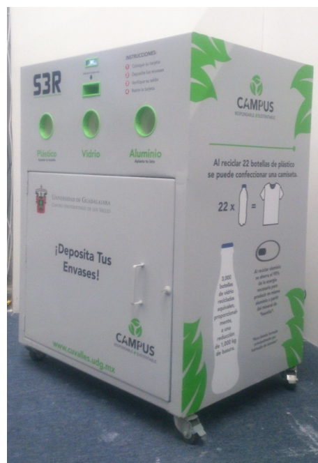
Figura 3. Prototipo S3R, vista en perspectiva derecha.