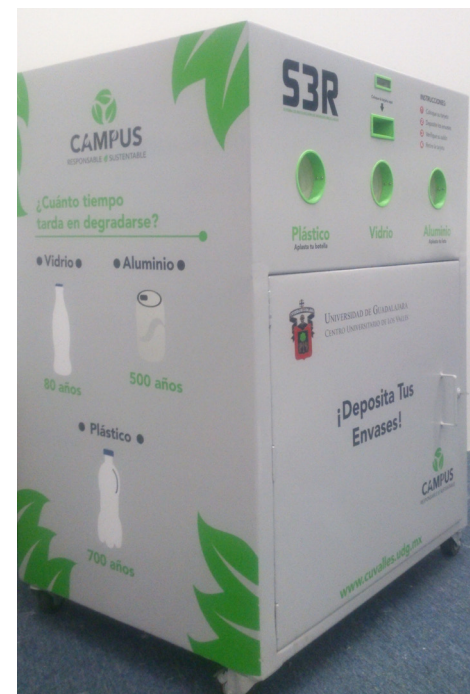
Figura 3. Prototipo S3R, vista en perspectiva izquierda.