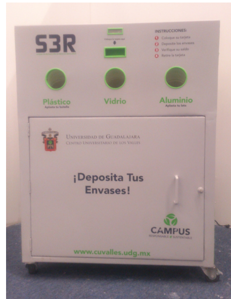
Figura 2. Prototipo S3R, vista frontal.

detección. En el caso de la pantalla, se implementó una de cristal líquido, de 16X2 caracteres. Con los elementos seleccionados fue posible implementar por completo el módulo de control electrónico con las características de operación que se describieron.