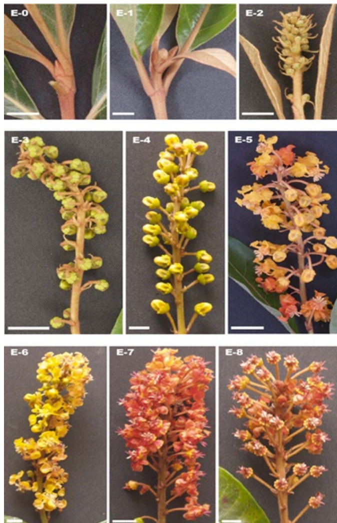
Figura 1. Estados fenológicos de la floración del nanche selección Mejorado con sus respectivas denominaciones (E-1 a E-8). Remítase a la Tabla 1 para la descripción macroscópica de cada estado de desarrollo de la inflorescencia. La escala representa 1.0 cm de longitud.

Figure 1. Phenological flowering stages of the Mejorado nance (E-1 to E-8). See Table 1 for the macroscopic description of each stage of inflorescence development. The scale represents a length of 1.0 cm.