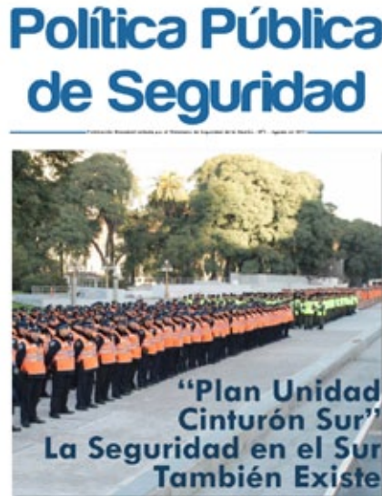
Ilustración 3. Tapa de la publicación bimestral del Ministerio de la Nación 34

Al respecto, es importante resaltar que, si bien la vinculación entre mayor despliegue policial y prevención del delito constituye una asociación medular del discurso hegemónico de la inseguridad desde la década de los noventa, es posible dar cuenta aquí de cierto desplazamiento en este entramado discursivo. En efecto, allí el acento suele estar puesto en perseguir los delitos sufridos por las clases medias y altas y, en consonancia, son los territorios donde estas clases habitaban los cuales deben ser provistos de mayores niveles de vigilancia policial. En los discursos ministeriales, esta asociación es invertida: no son las clases acomodadas, sino los más pobres los que más sufren el delito y por tanto quienes deben tener mayores niveles de vigilancia policial.