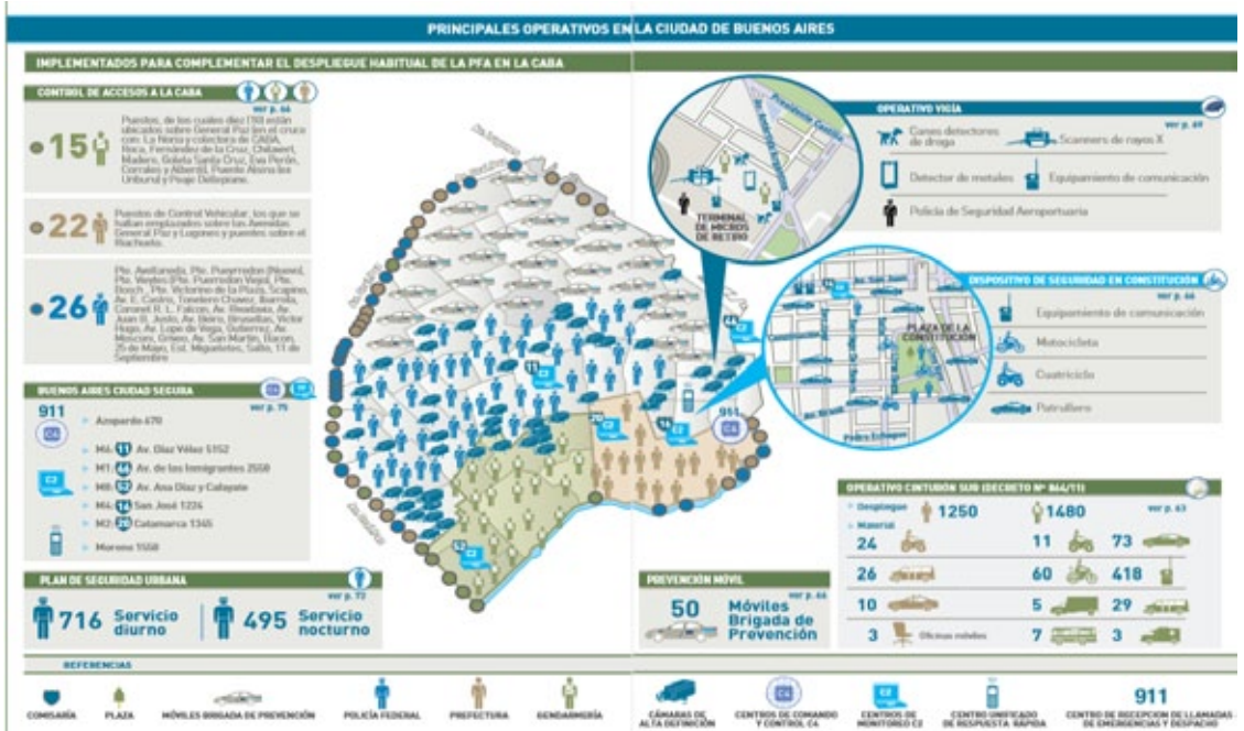
Gráfico 1. Principales operativos en la ciudad de Buenos Aires 29

Un segundo aspecto de estos planes que capta la atención se refiere al tipo de delitos que se pretende perseguir. En efecto, estos planes de refuerzo policial se encuentran destinados fundamentalmente a la persecución del delito común, esto es, un tipo de delito, que en el sentido común dominante, se asocia a las clases populares. Entendemos que en los discursos ministeriales la equivalencia entre delincuencia y delito común tiene el carácter de lo “evidente”. Ello se manifiesta claramente en el anuncio titulado “Balance y resultados a un año del Plan Cinturón Sur”, publicado en el año 2012. El anuncio, de cuatro minutos de duración, tiene como objetivo mostrar los resultados (luego de un año de desarrollo del plan) en los barrios del sur de la ciudad. El video comienza mostrando un fragmento de un discurso de la presidenta de la nación, Cristina Fernández de Kirchner, donde argumenta sobre la importancia de reforzar la seguridad en las zonas empobrecidas de la población. El anuncio continúa con datos sobre la cantidad de efectivos reubicados con el plan, las cuales son alternadas con fragmentos de entrevistas a distintos vecinos y vecinas del barrio, quienes comentan sobre los cambios y beneficios que percibieron a partir del desarrollo de un mayor despliegue policial en esos territorios. Una serie de números indicativos de la disminución del delito en la zona acompañan la filmación de los testimonios. Así se puede ver en las siguientes capturas de pantallas: