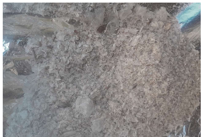
Figura 23. Obtención del quitosano en forma de polvo blanquecino. Figure 23. Chitosan obtained as a whitish powder.