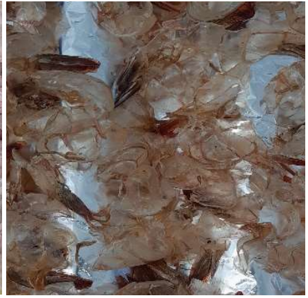
Figura 13. Secado de los exoesqueletos en papel aluminio. Figure 13. Drying of the exoskeletons on aluminum foil.