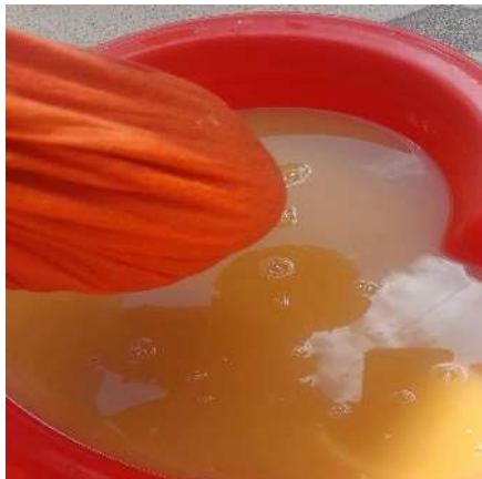
Figura 8. Proceso de filtración para eliminar las fibras de cáscaras. Figure 8. Filtration process to remove peel fibers.

Pasado el tiempo de secado, se procedió a realizar un tratamiento alcalino suave con la finalidad de eliminar las proteínas y restos de materia orgánica aún adheridos a la quitina del exoesqueleto (Figuras 14-16). Estos fueron triturados hasta obtener un material particulado homogéneo, el cual sirvió como materia prima para la etapa de desproteínización. A continuación, se vertió en carbonato de sodio al 4 %, el producto obtenido a 40 °C y por 3 horas, las moléculas proteicas se desnaturalizan dejando una fase sólida más pura de quitina. (Figuras 17-18).