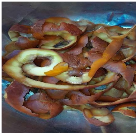
Figura 2. Cáscaras de cocona, naranja y manzana.

Figure 2. Cocona, orange, and apple peels.