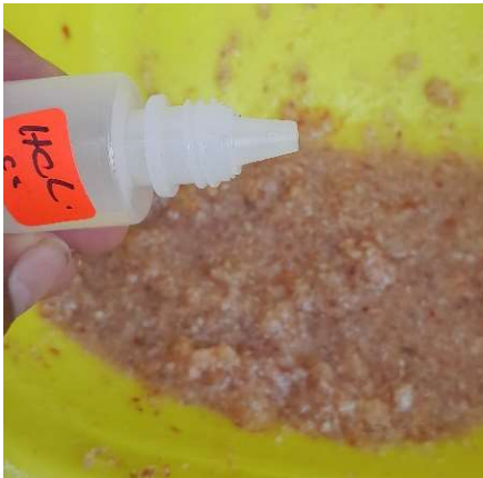
Figura 19. Desmineralización vertiendo ácido clorhídrico. Figure 19. Demineralization by adding hydrochloric acid.

Para realizar el blanqueamiento necesario al producto, se hizo una inmersión en carbonato de sodio al 4% a temperatura ambiente durante 4 días. Después, lo obtenido se filtró y calentó a 30 °C, con la intención de acelerar la evaporación del exceso de humedad y favorecer a las reacciones químicas residuales de blanqueamiento, reduciendo tiempos sin dañar la estructura polímera (Figuras 21-22). Al finalizar, se obtuvo el producto en forma de polvo blanquecino (Figura 23).