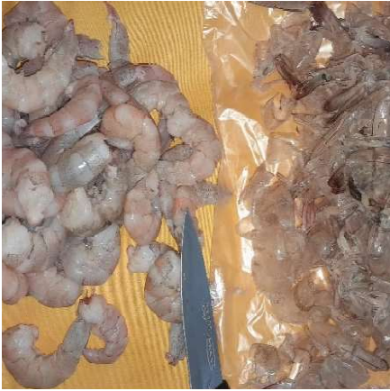
Figura 11. Extracción del exoesqueleto del Camarón ( Litopenaeus vannamei ) Figure 11. Extraction of the exoskeleton from shrimp ( Litopenaeus vannamei ).