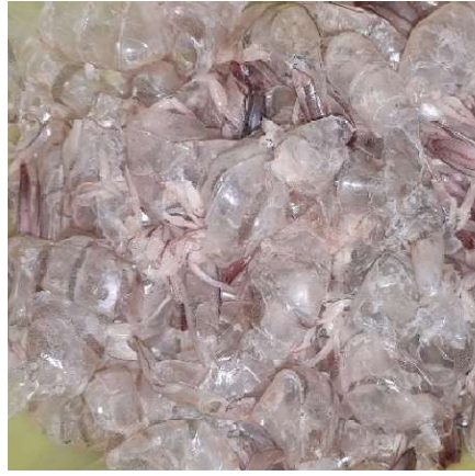
Figura 12. Exoesqueletos limpios de los camarones ( Litopenaeus vannamei ). Figure 12. Clean shrimp exoskeletons ( Litopenaeus vannamei ).