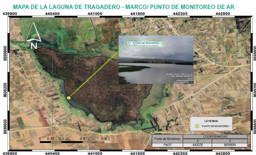
Figura 1. Punto de Monitoreo del área de estudio. Figure 1. Monitoring point of the study area.

Extracción de la Pectina. La metodología utilizada se adaptó a la descrita por (Molina-Soler, 2016 3 ), para la extracción de la pectina se han empleado las cascarás de cocona ( Solanum sessiliflorum ), manzana ( malus domestica ) y naranja ( Citrus sinensis ). En la selección y pesaje de la materia prima de 2 kg de cocona se obtuvo 228 g de cáscara, de 1kg de manzanas se aislaron 82 g de piel y finalmente de 1 kg de naranjas se recuperaron 166 g de albedo y flavedo. Estos fueron pesados por una balanza analítica AS 220.X2 – RADWAG. En el tratamiento térmico inicial las cáscaras separadas fueron sumergidas en agua a 95 °C por 15 min, con el objetivo de ablandar el tejido celular y desactivar las enzimas pectinolíticas. Posteriormente se traspasó a un recipiente con agua a una temperatura ambiente (24 °C) para detener la acción térmica y facilitar la remoción manual de la cáscara, semillas y restos de pulpa adheridos. Las muestras de cáscara fueron deshidratadas en una estufa 50 °C por 24 h (Figuras 2-5) con el fin de eliminar completamente el agua residual sin comprometer la integridad de la pectina. El material seco se sometió a molienda y posteriormente se tamizó para uniformizar el tamaño de partícula, asegurando así una materia prima homogénea y libre de contaminantes.