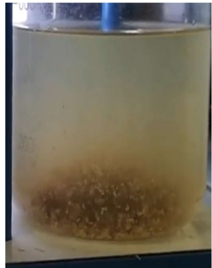
Figura 26. Se deja en reposo para observar la formación los flóculos. Figure 26. The suspension is left to stand to observe floc formation.