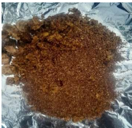
Figura 5. Tamizado de las cáscaras de cocona, naranja y manzana.

Finalmente se filtró con una tela 100% poliéster la cual elimina el material sólido no disuelto (fibras de cáscaras) obteniéndose un extracto líquido rico en pectina, al producto filtrado se vertió alcohol etílico al 96% y se dejó reposar por 2 horas a una temperatura ambiente (Figuras 8-10). Puesto que la pectina es insoluble en etanol, al mezclar el extracto acuoso con alcohol la pectina se precipita o flota formando un gel blanco. Permitiendo así, que la pectina salga a flote, la cual se filtró nuevamente con una tela de 100% poliéster. A la pectina obtenida se realizaron 3 lavados con etanol (v/v) empleando 60 mL por cada lavado para ser purificada. En conjunto este proceso de precipitación y múltiples lavados con alcohol permite obtener una pectina de alto grado de pureza.