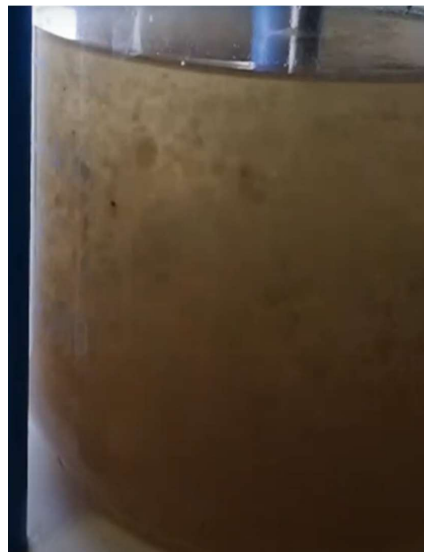
Figura 25. La suspensión se agita en un agitador mecánico. Figure 25. The suspension is stirred using a mechanical stirrer.