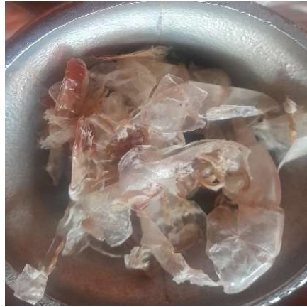
Figura 15. Exoesqueletos antes de la molienda. Figure 15. Exoskeletons before grinding