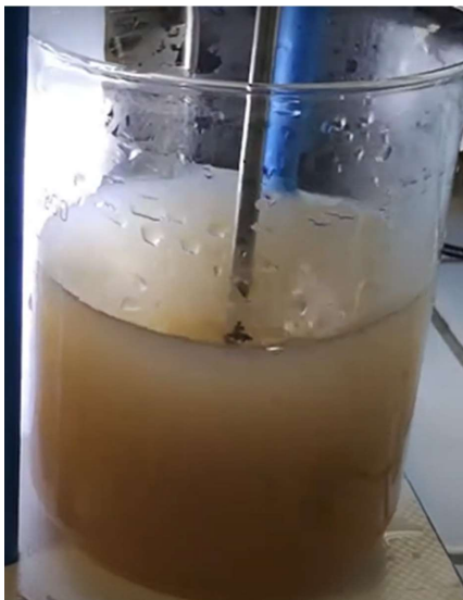
Figura 24. Se muestra el agua a tratar mezclada con los biopolímeros. Figure 24. Wastewater to be treated mixed with the biopolymers is shown.

Los resultados del análisis fisicoquímico en el área de influencia de la Laguna de Tragadero indican una condición interesante del cuerpo de agua que se ve afectado por la descarga de aguas residuales. Un pH de 7.30 es bastante neutro y sugiere que el agua no es ni demasiado ácida ni alcalina, lo cual es favorable para la mayoría de los procesos biológicos. Sin embargo, la Demanda Bioquímica de Oxígeno (DBO) es significativamente alta con 146.6 \text{ mg L}^{-1} , lo que implica una considerable cantidad de materia orgánica biodegradable en el agua que requiere oxígeno para ser descompuesta por microorganismos. En contraste, la Demanda Química de Oxígeno (DQO) de 75.0 \text{ mg L}^{-1} , aunque también indica contaminación, es menor que la DBO, lo que podría sugerir la presencia de compuestos orgánicos más resistentes a la degradación química.