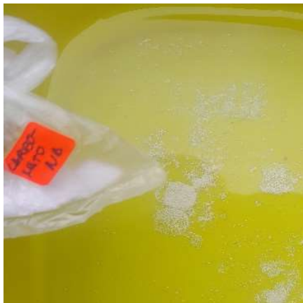
Figura 17. Vertido de Carbonato de sodio para la desproteínización. Figure 17. Addition of sodium carbonate for deproteinization.