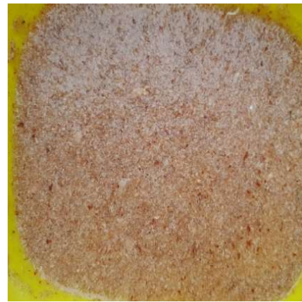
Figura 18. Reposo del carbonato de sodio con el exoesqueleto. Figure 18. Resting period of sodium carbonate with the exoskeleton.