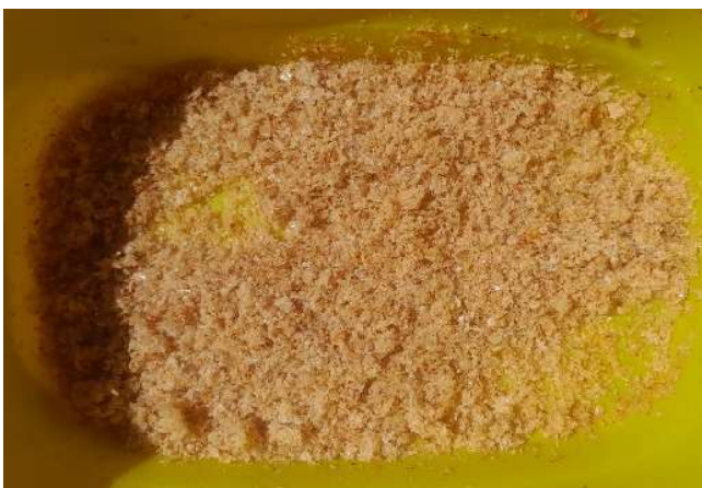
Figura 22. Material posterior al tratamiento. Tras el tiempo establecido, el material se filtró y calentó. Figure 22. Material after treatment. After the established time, the material was filtered and heated.