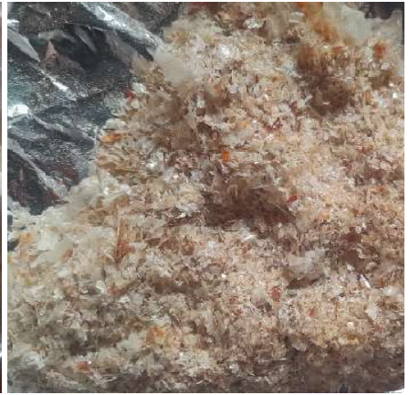
Figura 16. Material molido. Figure 16. Ground material.