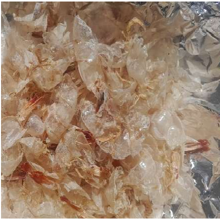
Figura 14. Exoesqueletos previamente secados sobre papel de aluminio. Figure 14. Exoskeletons previously dried on aluminum foil.