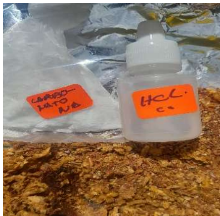
Figura 6. Solutio HCl para crear un medio ácido.

Figure 5. Sieving of cocona, orange and apple peels.