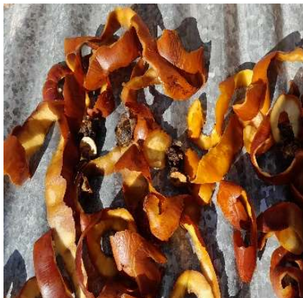
Figura 3. Secado de las cáscaras de cocona, naranja y manzana.

Figure 2. Cocona, orange, and apple peels.