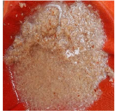
Figura 21. Inmersión de exoesqueletos de camarón en carbonato de sodio. Mezcla durante la inmersión. Figure 21. Inmersión de exoesqueletos de camarón en carbonato de sodio. Mezcla durante la inmersión.