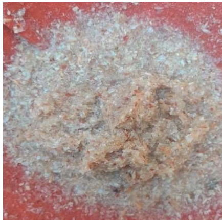
Figura 20. Reposo del exoesqueleto en contacto con el ácido clorhídrico. Figure 20. Resting period of the exoskeleton in contact with hydrochloric acid.