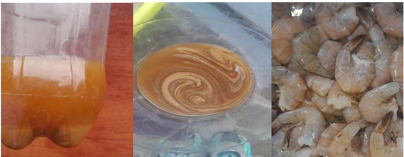
Figura 10. Pectina obtenida de coloración blanquecina saliendo a flote. Camarón ( Litopenaeus vannamei ). Figure 10. Whitish pectin obtained, floating to the surface. Shrimp ( Litopenaeus vannamei ).