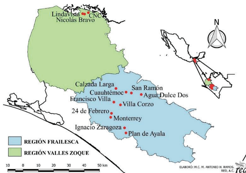
Figura 1. Localización de los sitios de muestreo en las regiones Frailesca y Valles Zoque, Chiapas, México.

Se observó una relación exponencial negativa entre el porcentaje de saturación de aluminio ( \text{Al}^{3+} ) y la capacidad de intercambio catiónico, el pH y el calcio ( \text{Ca}^{2+} ) intercambiable (Figura 2), en los tres casos con coeficientes de determinación ( r^2 ) iguales o superiores al 40%, siendo más estrecha dicha dependencia con el porcentaje de \text{Ca}^{2+} , con un coeficiente de determinación de 82%. Se debe destacar que los mayores valores de saturación de aluminio se presentaron en los suelos de la región Frailesca (datos no mostrados), lo cual constituye una alerta ante la acidificación de los suelos