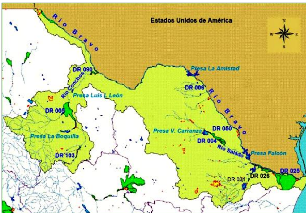
Figura 2. Ubicación de los distritos de riego, principales presas y afluentes del río Bravo (sección mexicana).

1.- Duración (D) : número de años consecutivos con aportaciones inferiores a la mediana, adimensional.