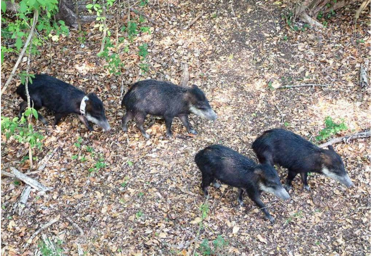
Figura 2. Pecaríes de labios blancos ( Tayassu pecari ). Reserva de la Biosfera Calakmul, Campeche.

El pecarí de labios blancos se distingue considerablemente de otros mamíferos neotropicales por las grandes manadas que llega a formar y que pueden sobrepasar los 100 individuos (Sowls 1997). El tamaño promedio de los grupos registrados en México es de 13 - 28 individuos (Naranjo 2002; Reyna 2002). Su densidad poblacional se ha estimado entre 1 y 15 individuos/km 2 , aunque con frecuencia estas cifras se encuentran por debajo de 5 ind/km 2 en sitios con cacería persistente (Bodmer et al. 1997; Naranjo et al. 2004a; Sowls 1997). Este mamífero requiere para sobrevivir de áreas forestales extensas (>10,000 ha) y sin actividad humana, preferentemente selvas altas y medianas húmedas, así como bosques bajos inundables (March 2005; Mayer y Wetzel 1987; Reyna 2007).