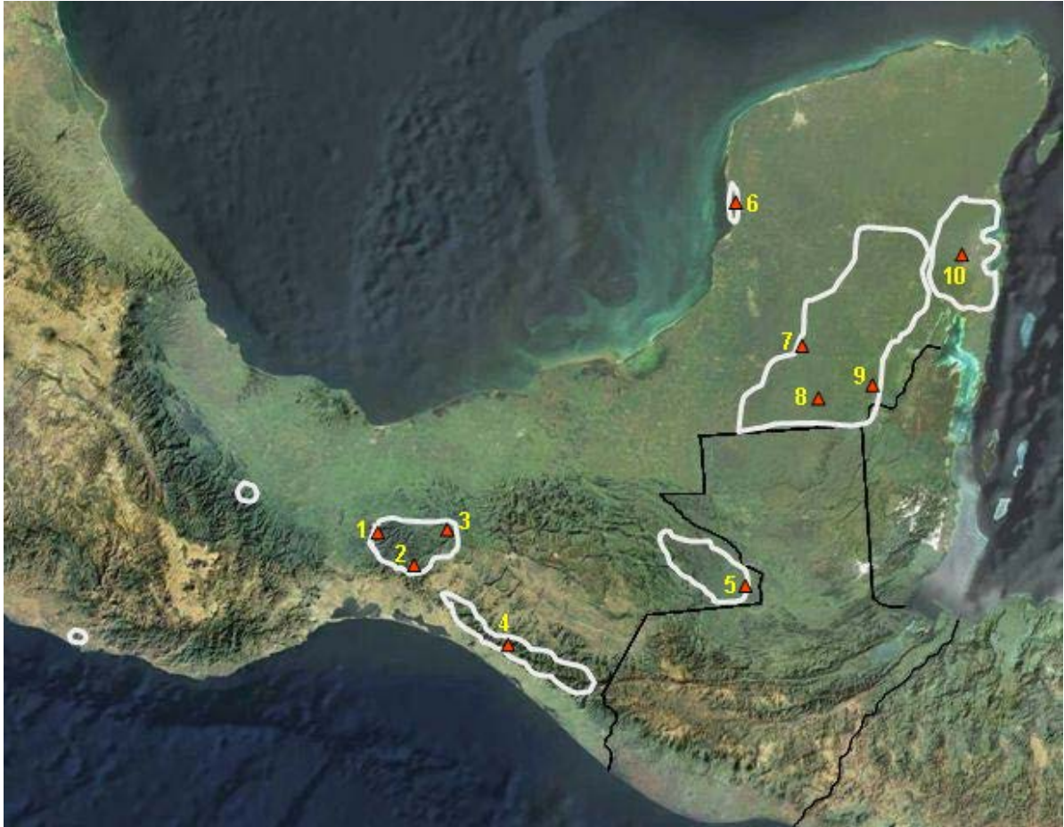
Figura 3. Ubicación de los sitios de estudio donde se evaluaron poblaciones de tapir y pecarí de labios blancos: 1) Uxpanapa, 2) Los Chimalapas, 3) Selva El Ocote, 4) La Fraylescana, 5) Marqués de Comillas, 6) Los Petenes, 7) Balam-kin y Balamkú, 8) Calakmul, 9) Ejidos forestales de Quintana Roo, 10) Sian Ka'an. Las áreas delineadas indican la distribución aproximada del tapir.

son las selvas bajas caducifolias, selvas medianas subperennifolias, bosques de pino, bosques de encino y bosques mesófilos de montaña. En el área existen registros recientes de tapir, pero no de pecarí de labios blancos. Parte del área protegida está ocupada por pastizales inducidos, cafetales y cultivos de temporal. En el área existen procesos de deforestación por extracción de madera, expansión de la ganadería y la agricultura, cacería furtiva, erosión e incendios forestales (Pérez-Farrera et al. 2006). Los muestreos se efectuaron en la Finca Arroyo Negro, municipio de La Concordia, Chiapas.