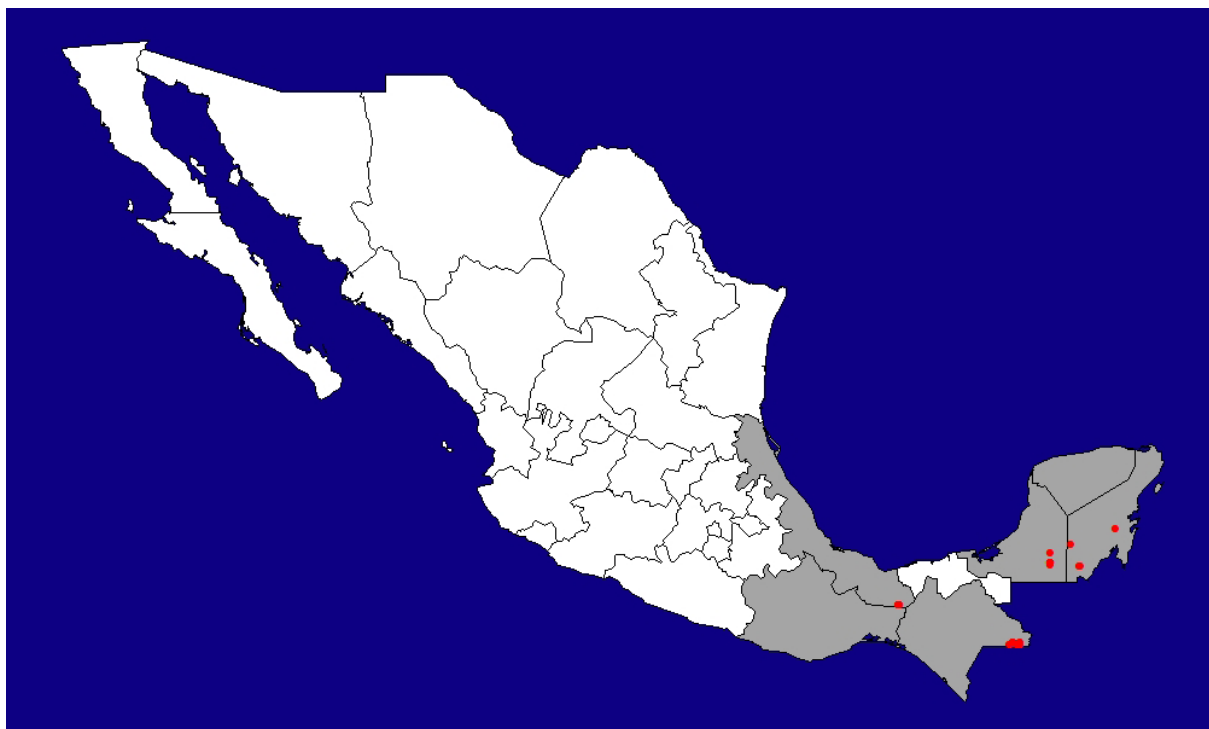
Figura 5. Distribución actual del pecarí de labios blancos ( Tayassu pecari ) en México con base exclusivamente en los registros obtenidos ( n = 26 ) en el trabajo de campo del presente proyecto. Mapa: Fredy Falconi Briones.

de labios blancos solamente persiste en siete de los 10 sitios de estudio (ausente de La Fraylescana, Selva El Ocote y Los Petenes) y en 12 de las 20 comunidades visitadas. Prácticamente todos (100 %) los pobladores consultados conocen a las dos especies ya sea por observación directa de animales vivos o cazados, o por referencia directa de sus padres y abuelos. La gran mayoría (81 %; 90/111) de los entrevistados aseguró que el tapir está presente en sus comunidades, mientras que el 15.3 % (17/111) afirmó que esta especie ya no está presente, y el restante 3.7 % (4/111) dijo no estar seguro. En el caso del pecarí de labios blancos, solamente el 34.2 % (38/111) de los entrevistados dijo que la especie aún está presente en su comunidad, mientras que la mayoría de ellos (59.5 %; 66/111) afirmó que ya no está presente, y el restante 6.3 % (7/111) no sabía. La percepción de los habitantes de los sitios de estudio evaluada a través de las entrevistas realizadas sugiere que el pecarí de labios blancos tiene actualmente una distribución notablemente más restringida que la del tapir en el país, lo cual coincide plenamente con los registros fotográficos y avistamientos de ejemplares y sus rastros logrados en este estudio.