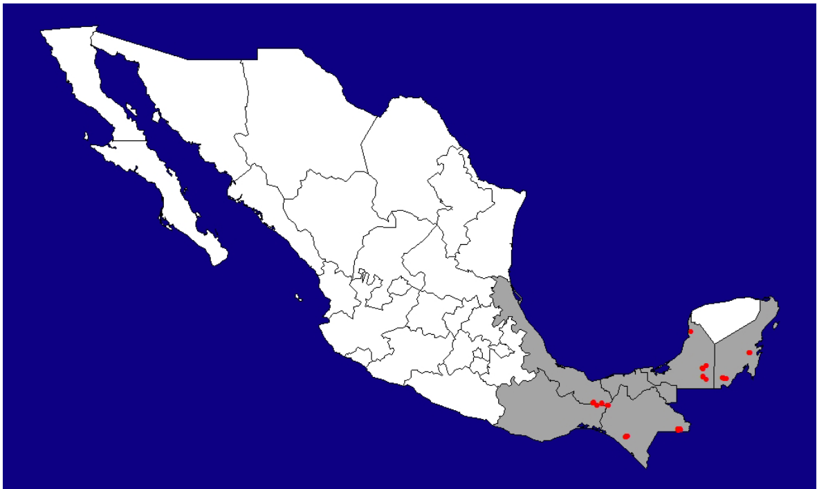
Figura 4. Distribución actual del tapir ( Tapirus bairdii ) en México con base exclusivamente en los registros obtenidos ( n = 79 ) en el trabajo de campo del presente proyecto. Mapa: Fredy Falconi Briones.

El total acumulado de entrevistas realizadas con pobladores de 20 comunidades rurales en los sitios de estudio fue de 111. Los análisis de la información relacionada con la distribución de ambas especies recabada en las entrevistas confirmaron que el tapir está presente en todos los sitios de estudio y en 18 de las 20 comunidades visitadas, faltando solamente en Benemérito de las Américas y Quiringuicharo (Selva Lacandona) desde hace 10 - 20 años. Por el contrario, el pecarí