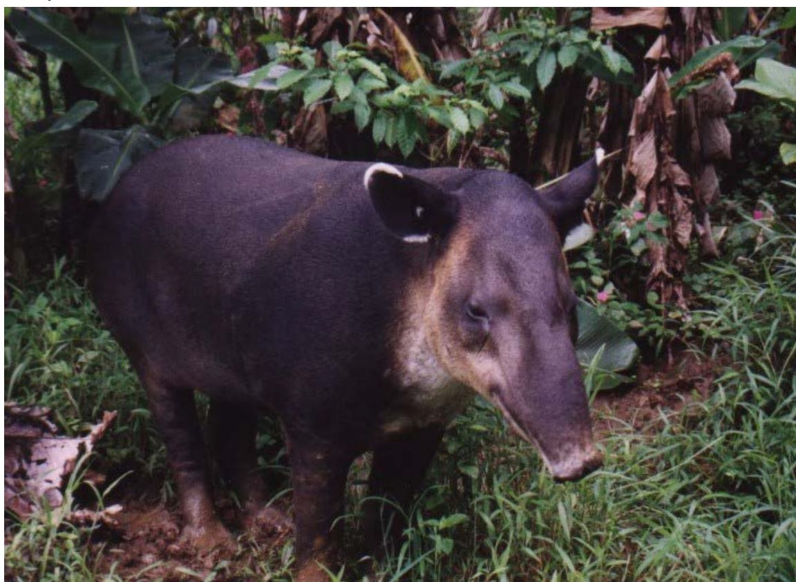
Figura 1. Tapir centroamericano ( Tapirus bairdii ). Selva Lacandona, Chiapas.

La investigación realizada sobre el tapir en el país se ha limitado a unas pocas poblaciones. La abundancia poblacional, las preferencias de hábitat, el rango de acción individual y los hábitos de alimentación de tapires han sido estudiados en algunas localidades de Chiapas Campeche y Oaxaca mediante conteos de individuos y rastros en transectos lineales (Lira y Naranjo 2005; Muench 2001; Naranjo y Cruz 1998; Naranjo y Bodmer 2002), observación de plantas ramoneadas y análisis de excrementos (Cruz 2001; Naranjo y Cruz 1998; O'Farril et al. 2006; Rivadeneyra 2007; Naranjo 2009), radiotelemetría (Lira 2006; Naranjo y Bodmer 2002) y foto-trampeo (Carbajal-Borges et al. 2014; Lira et al. 2014; Pérez y Matus 2010). Las estimaciones de densidad disponibles para México se ubican entre 0.01 y 0.5 tapires/km 2 (Carbajal-Borges et al. 2014; Naranjo 2009). Considerando estas densidades tan bajas, resulta evidente que solo unas pocas reservas en el país parecen ser suficientemente grandes para albergar poblaciones viables de tapires conformadas por varios cientos de individuos (Naranjo 2009). Los factores de amenaza más importantes para el tapir son indudablemente la pérdida de hábitat y la cacería sin control (March y Naranjo 2005; Naranjo 2014).