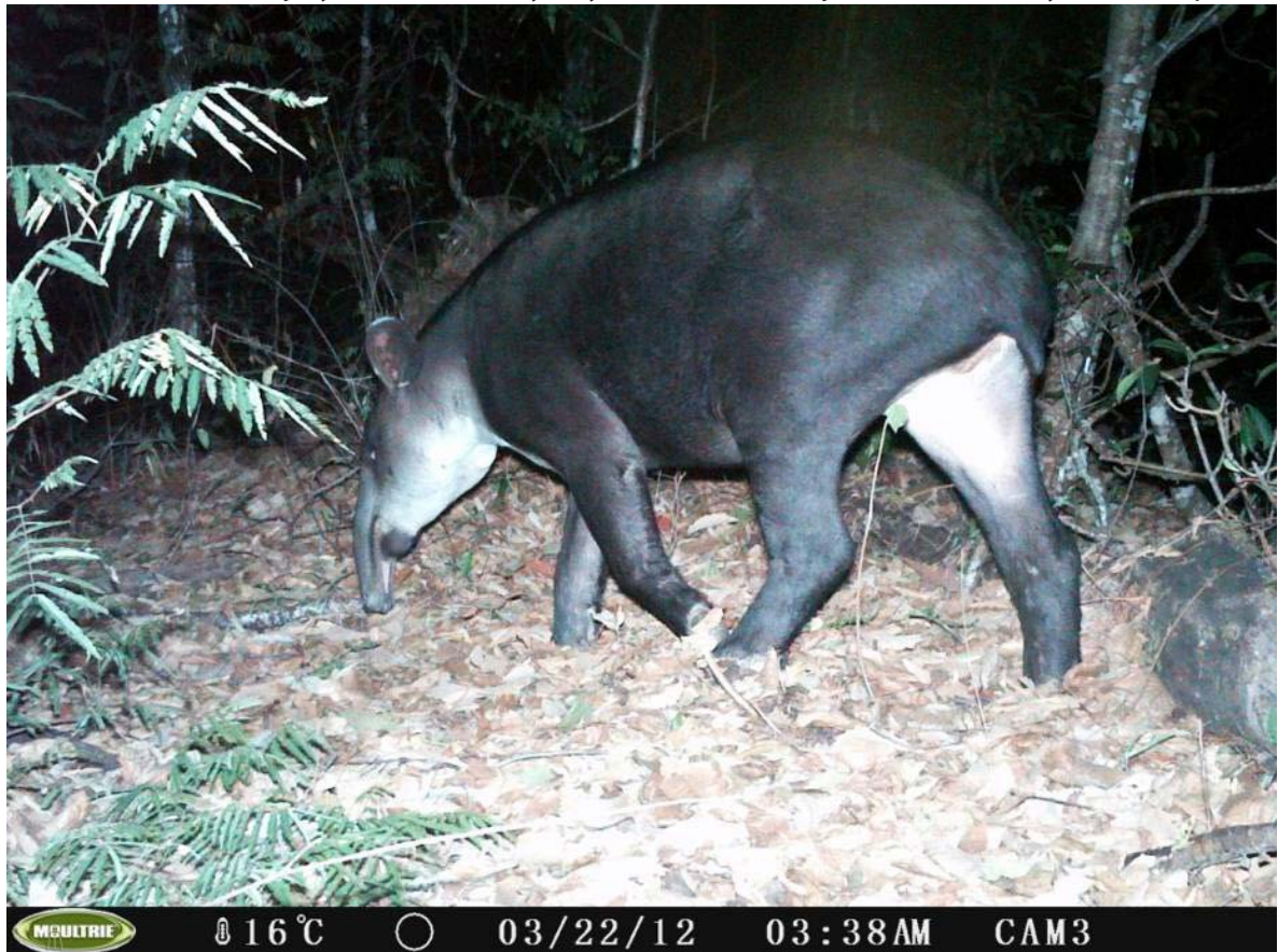
Figura 6. Hembra adulta de tapir ( Tapirus bairdii ) fotografiada durante el proyecto con cámara-trampa en la Reserva Balam-kin, Campeche.

Abundancia. Los índices de abundancia estimados a partir de muestreos en transectos lineales variaron entre 0.26 - 4.52 rastros de tapires, y 0.15 - 0.63 rastros de pecaríes de labios blancos por 10 km recorridos (Figuras 7 y 8, Tabla 3). En el caso del tapir, los valores de abundancia obtenidos en este estudio se encuentran dentro del rango de abundancias estimadas en estudios previos realizados en México (0.05 a 8.1 rastros por 10 km; Lira et al. 2004; Naranjo 2009; Naranjo y Bodmer 2002; Naranjo y Cruz 1998; Reyna y Tanner 2007; Tejeda et al. 2009) y en otros países