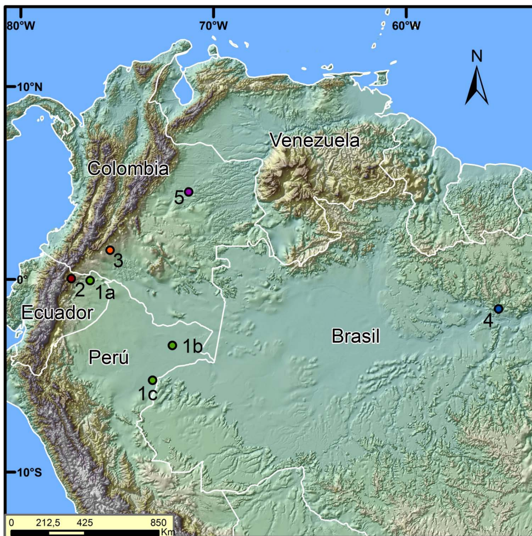
Figura 2: Localidades de los reportes de P. pallidoptera . 1a) Ecuador: Orellana; 66 km al Sur de Pompeya Sur, 0°48'S, -76° 24' W. 1b) Perú: Loreto; Río Amazonas, Orosa, 03° 26' S, -72° 08' W; 1c) Perú: Río Galvez, Nuevo San Juan, 05° 14' 50" S, -73° 09' 50" W (Lim et al. , 2010). 2) Ecuador: Bosque del Aguarico a 20 km de Lumbaqui, 0° 2' 4.17" N, -71° 24' 13.93" W (McDonough et al. , 2011). 3) Colombia: Caquetá, Montañita 1° 30' 9.6" N; -75° 22' 5.9" W, (Suarez-Castro et al. , 2012). 4) Brasil: Pará, Curuá, Mamiá Village, 1° 32' 14.7" S, -55° 12' 30.1" W (De Castro et al. , 2012). 5) Colombia: Meta, Puerto López, Carimagua, 4° 31' 36" N, -71° 17' 43" W (ICN 21,233).

de colecta para adicionar especímenes a las colecciones (Lim et al. 2010); para tener más herramientas en estudios posteriores de la especie.