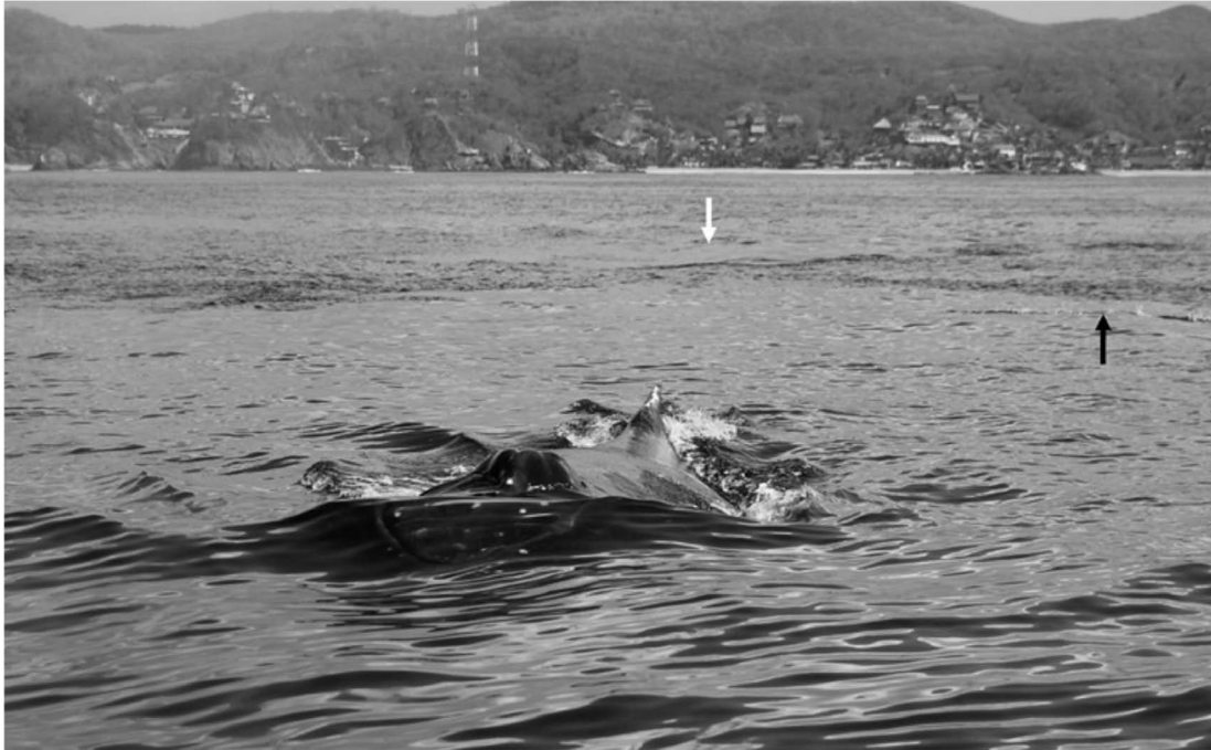
Fig. 2. Ballena jorobada emergiendo horizontalmente y desplazándose en esta posición en línea recta para finalizar la maniobra de alimentación. La flecha en blanco indica la huella de buceo o inicio de la maniobra y la negra el remanente de la línea de anchovetas (Cupleiformes).

mostrando su aleta caudal, lo que permitió tomar fotografías de la aleta, la cual fue ingresada al catálogo FIBCCO, con la clave de identificación 5OAX012.12FV1.