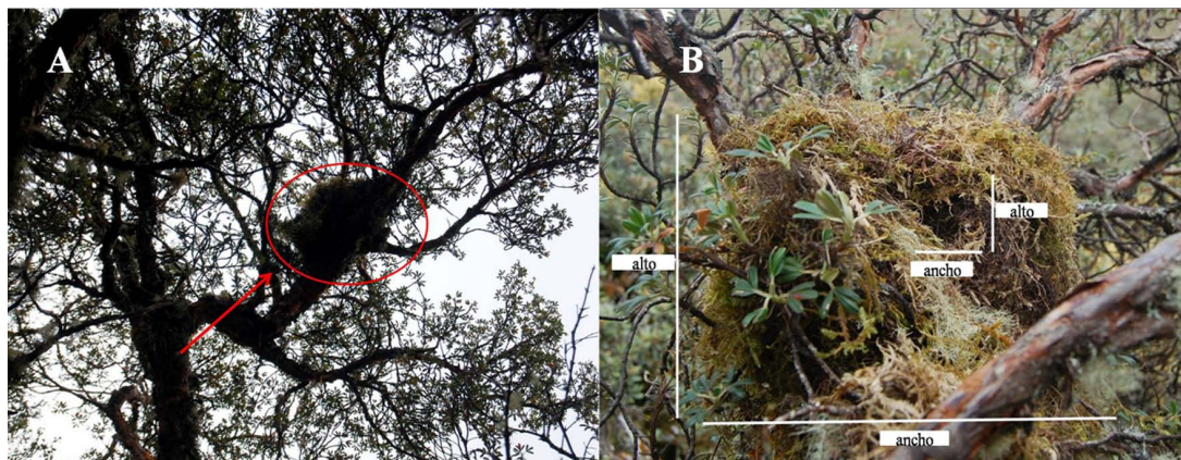
Fig. 2. A= Nido de Thomasomys aureus en un árbol de Polylepis incana , visto desde el suelo; B= nido con medidas principales.

presentaron en promedio las siguientes medidas: Cabeza y cuerpo 90 mm; largo de la cola 120 mm; largo de la pata 29 mm; largo de la oreja 18 mm; peso 25 g. Los nidos tenían las siguientes características y medidas promedio: forma alargada (macho) y circular (hembras), 16.6 cm de longitud, 11 cm ancho, alto 6.6 cm (Tabla.1). Todos los nidos tenían dos entradas, la principal (2-2.5 cm) con dirección norte y la secundaria (1.2-1.8 cm) con dirección sur. Un nido (macho), se encontró a 65 m del sitio de captura, bajo las raíces de Gynoxys sodiroi , el segundo nido (hembra) estaba ubicado a 160 m del sitio de captura, bajo las raíces de Lachemilla orbiculata . El tercer nido (hembra), fue hallado en un frailejón ( Espeletia pycnophyllia ), a 45 m del sitio de captura, entre hojas verdes y secas (Fig. 3 A-B) a 1.5 m de altura.