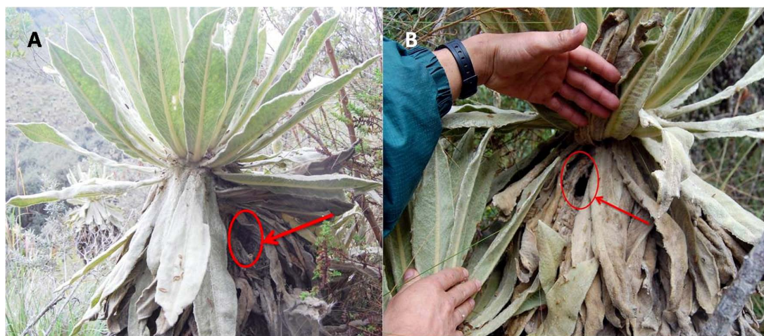
Fig. 3. Nido de Thomasomys paramorum en Espeletia pycnophyllia ; A= entrada anterior; B= entrada posterior.

Los nidos estaban contruidos en su totalidad por material vegetal. Aquellos hallados bajo la superficie fueron elaborados con cortezas de Polylepis incana y Calamagristis intermedia ; en los dos nidos, la cámara interna estaba forrada de diminutas, finas y picadas cortezas de P. incana . Para la construcción del tercer nido el material utilizado en su totalidad fueron hojas masticadas de frailejón ( Espeletia pycnophyllia ). En enero del 2010, el nido de un macho registró una cría (bien desarrollada), con los ojos abiertos y con pelo; su longitud total fue de 110 mm.