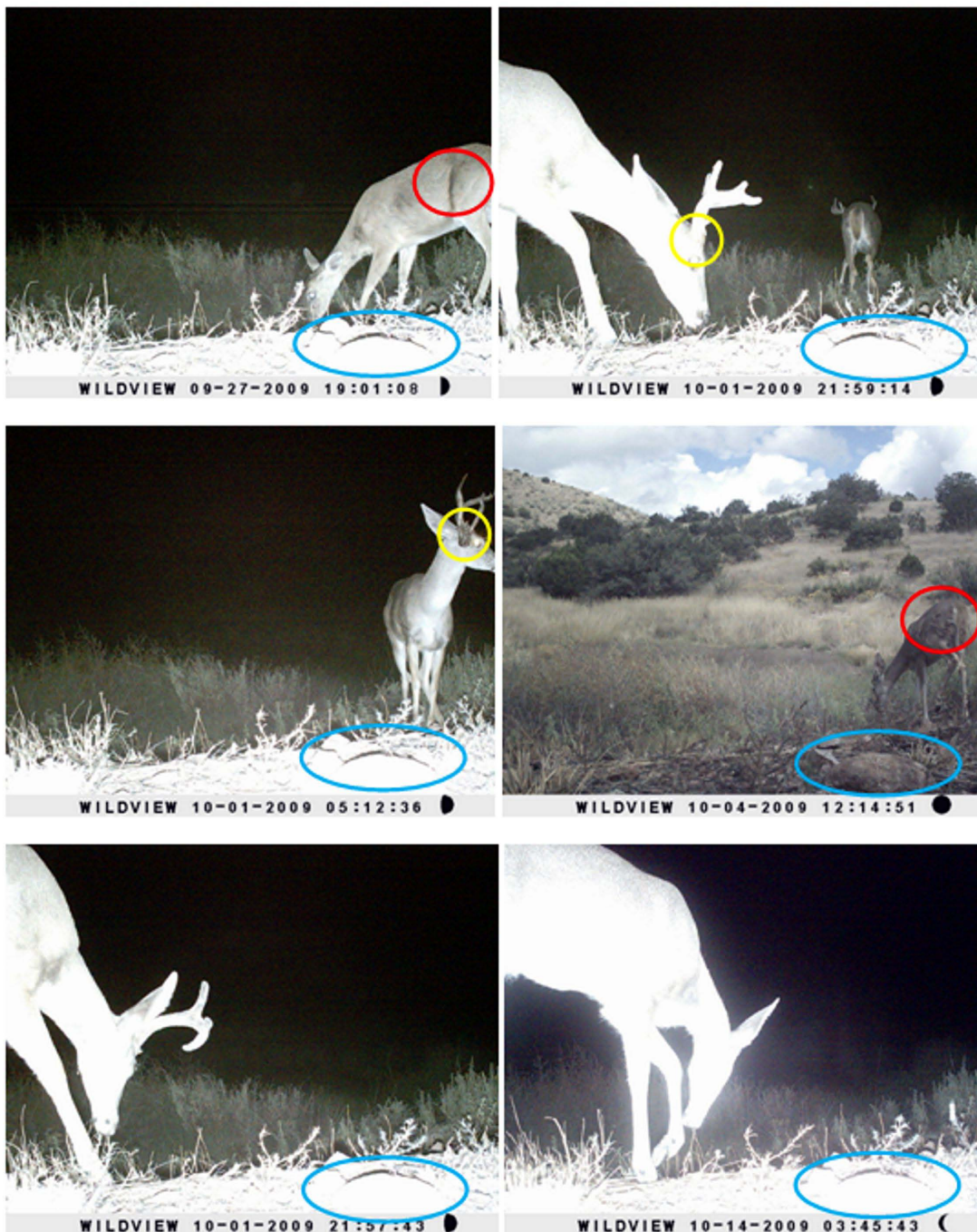
Figura 1. Secuencia de registros fotográficos obtenidos para el venado cola blanca ( Odocoileus virginianus ) en una de las trampas cámara durante el periodo de muestreo, ejemplificando el análisis para diferenciar individuos (ver texto).

Para estimar la densidad, primero calculamos el Área Efectiva de Muestreo (AEM). Este análisis se hizo usando Arcmap 10 (ESRI 2011). A partir de las localizaciones de las cámaras, se generó un círculo alrededor de cada punto de muestreo (trampa-cámara) mediante el uso de la herramienta buffer , procurando que las áreas superpuestas se disolvieran para evitar solapamiento entre los círculos, y por tanto sobreestimación del AEM. Esta área de amortiguamiento correspondió al ámbito hogareño de la especie (Smith 1991), por lo que para cada círculo consideramos un radio de 0.959 km (donde el radio es la raíz cuadrada del ámbito hogareño dividido por \pi ). Para el cálculo del AEM se usaron las herramientas