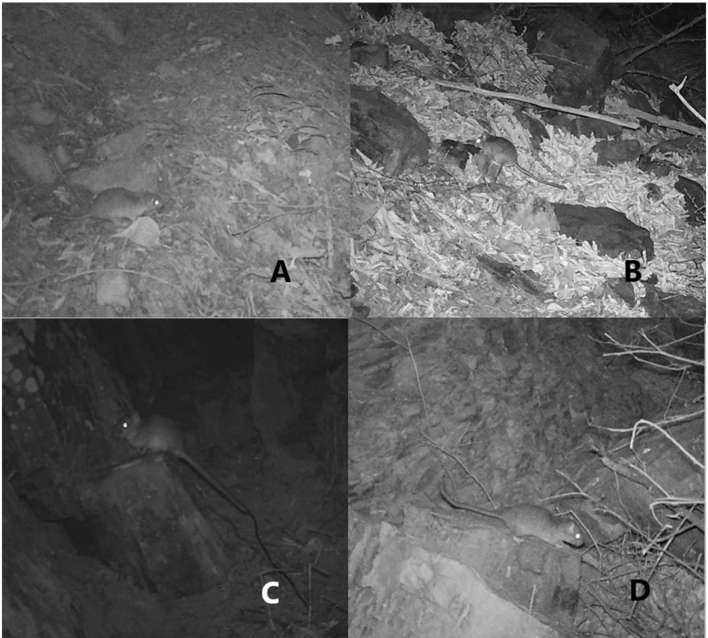
Figura 2. Registros de Abrocoma boliviensis en las trampas cámara. Donde (A) y (B) A. boliviensis se encuentra en un sustrato dominado por hojarasca, en la localidad de San Lorenzo y Lagarpampa-Mollepampa, respectivamente. Las figuras (C) y (D) muestran un sustrato predominantemente rocoso, en la localidad de San Lorenzo y Lagarpampa-Mollepampa, respectivamente.

determinan una probabilidad de ocupación ingenua (naïve occupancy) de 0.3023 para la época seca y 0.3396 para la época húmeda, las cuales nos sirven como base comparativa para demostrar las mejoras en los resultados obtenidos con una modelación integrando variables. Estos valores pueden ser interpretados como probabilidades de presencia de 30.23 % y 33.96 % de la especie en el área muestreada, comparable al 33 % obtenido por Mazzamuto et al. (2019) en una investigación de similares características, con enfoque en el puercoespín crestado ( Hystrix cristata , Hystricidae, Rodentia). Para poder explorar a mayor profundidad los factores que pueden influenciar la probabilidad que la especie esté presente y sea detectada, se procedió a correr los modelos que incluían las variables previamente mencionadas.