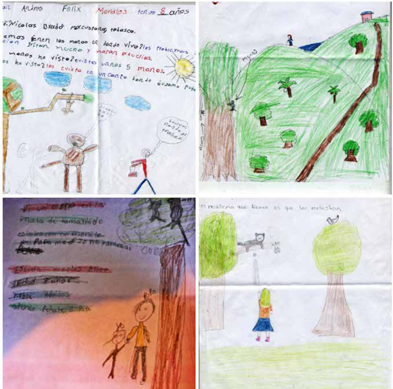
Figura 2. Encuentros cotidianos con los monos en las comunidades.