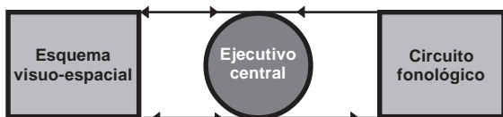
Figura 2. Modelo del componente triple de la memoria de trabajo (Baddeley, 2003).

El circuito fonológico contiene teóricamente dos componentes: un almacén fonológico que puede retener información por algunos segundos antes de que se olvide, y un sistema articulatorio de reforzamiento de repetición, análogo al de la repetición verbal 48 (figura 3). Así, mediante este mecanismo la información puede ser «refrescada» con la repetición verbal; sin embargo la memoria inmediata es limitada porque la articulación ocurre en tiempo real, de modo que al incrementar el número de estímulos consecutivos por recordar, llega un momento en que el primero ha sido olvidado antes de poder ser repetido. 47