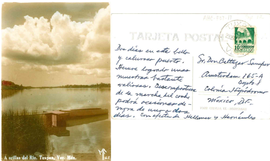
IMAGEN 8. POSTAL HELLMER-HERNÁNDEZ A SAMPER, 29 DE MARZO DE 1965

Podemos colegir que los últimos 11 años de su vida fueron especialmente difíciles al estar marcados por problemas de salud.