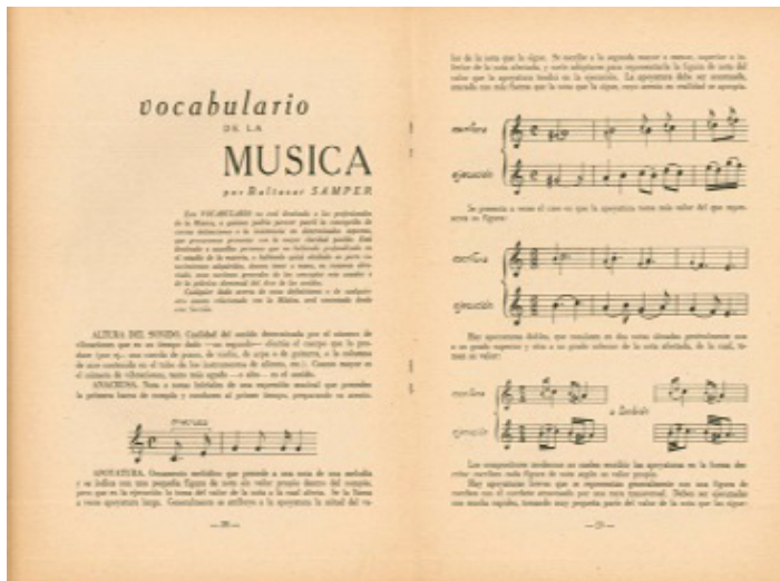
IMAGEN 4. “VOCABULARIO DE LA MÚSICA” POR BALTAZAR SAMPER