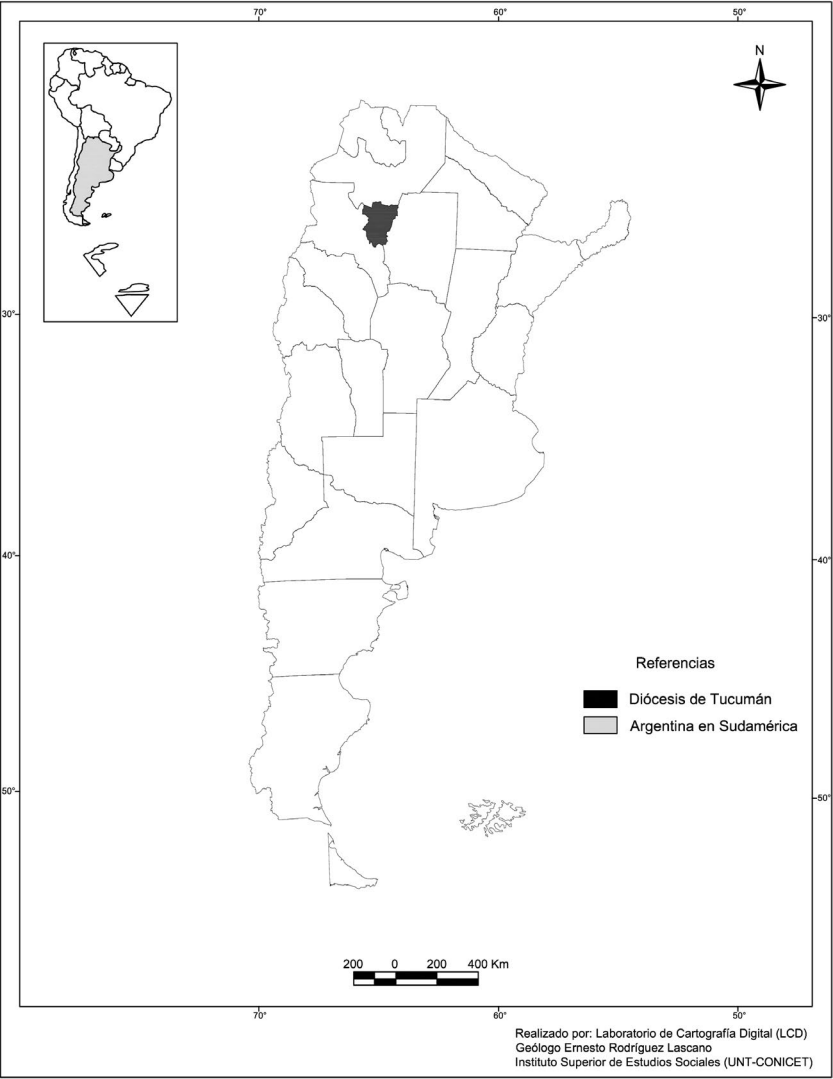
Mapa 1. Ubicación de la diócesis de Tucumán en Argentina (división política)