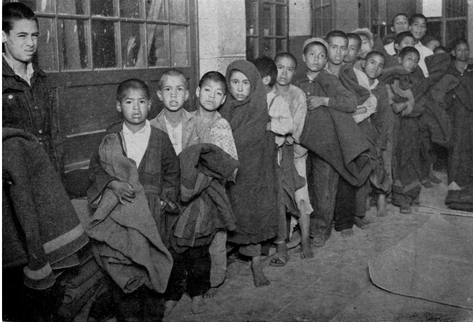
Imagen 2. Protección a la niñez. Recogidos cariñosamente de las calles y conducidos en grandes camiones de la beneficencia, los niños se dirigen a sus lechos. Velasco, Niño , 1935.

importantes de higiene y disciplina, también tuvieron el objetivo de hacerlos sentir como en casa y que llevaran una vida lo más “normal” posible. Era impensable dejarlos al azar porque ellos serían los “futuros” ciudadanos, y si se los dejaba en la calle era posible que se convirtieran en criminales, en “anormales” que con sus malos hábitos y acciones corrompieran a la sociedad y a la “raza”. Julio César Ríos y Ana María Talak señalan, para el caso de Argentina, que la preocupación por la infancia marginada se tradujo en iniciativas que buscaban “salvar” y “regenerar” a estos niños, por ello se crearon espacios cerrados que limitaban la “abierto e indómita libertad de la