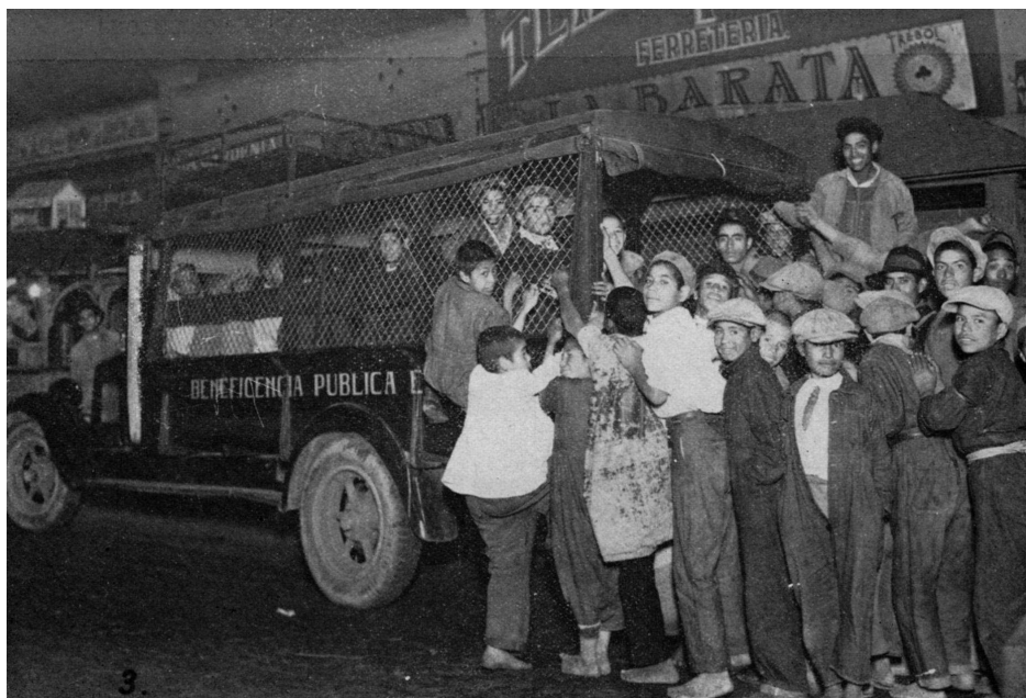
Imagen 1. Niños sin hogar que dormían en el arroyo. Abordando el automóvil de la beneficencia pública para dirigirse al dormitorio. Velasco, Niño , 1935.

La primera fotografía nos presenta a numerosos niños abordando los camiones que se pusieron a disposición de la beneficencia para sus recorridos en la noche. La imagen muestra la cara sonriente de los niños y su afán de subir al camión, la mayoría de ellos luce ropa desgastada y desaliñada, y casi todos están descalzos. En la segunda foto se muestra a los niños formados para poder entrar a los dormitorios, cada uno tiene una manta la cual les era proporcionada por el establecimiento y tenían que devolver a su salida. No obstante, la última foto muestra un cambio total que se puede observar desde el pie de foto: “niños ex mendigos”. En esta imagen se muestra a los niños mejor arregla-