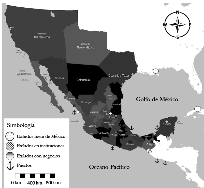
Mapa 1. Geografía humana del primer exilio federal centroamericano (1829-1840)