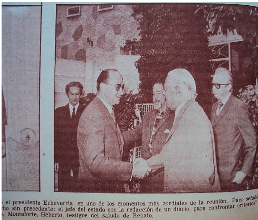
Imagen 3. El presidente Echeverría saluda al periodista Renato Leduc. Acompañan la escena Francisco Julião, a la izquierda, y Heberto Castillo, uno de los líderes históricos más importantes de la izquierda mexicana, a la derecha.

Fuente: Desayuno conmemorativo a los 20 años de la revista Siempre! , 18 de julio de 1973. Biblioteca Miguel Lerdo de Tejada. SHCP.