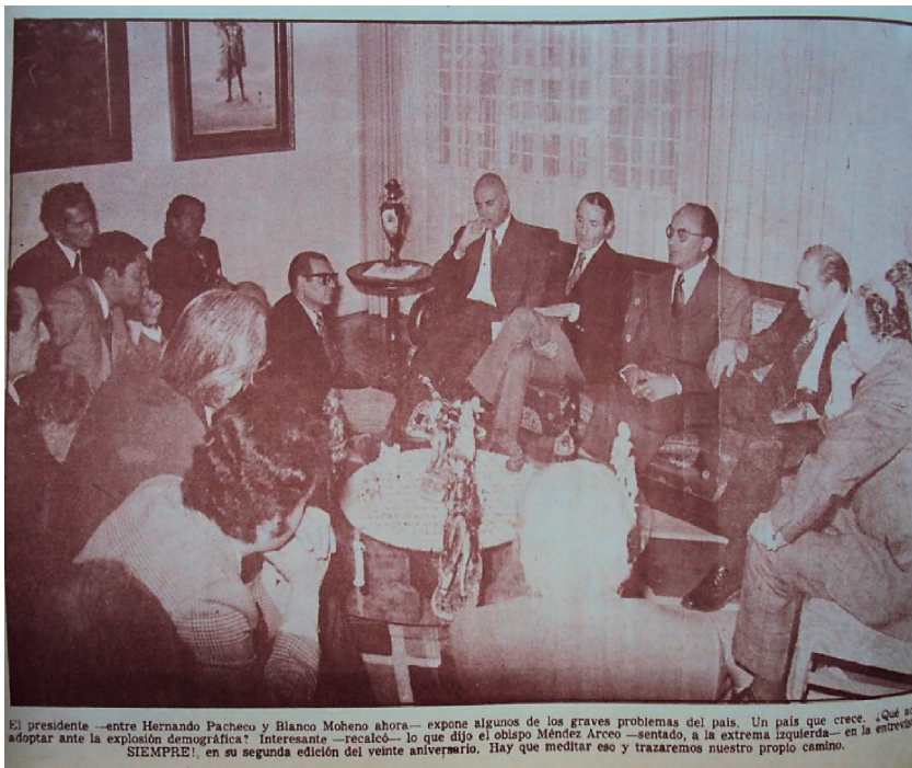
Imagen 4. Desayuno conmemorativo a los 20 años de la revista Siempre!, 18 de julio de 1973.