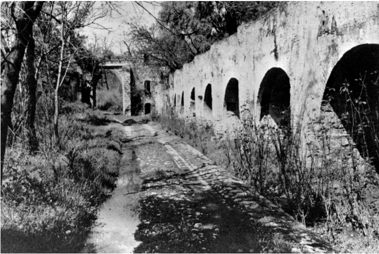
Foto 2. Ruinas del acueducto de La Escoba, Archivo personal de Federico de la Torre.