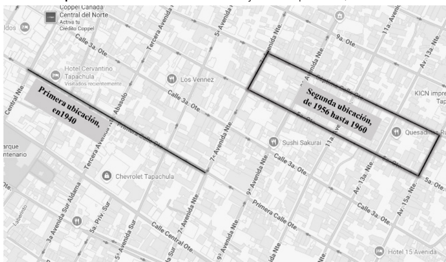
Mapa 1. Desarrollo de las zonas rojas en Tapachula, 1940-1960

Primera ubicación: aproximadamente en 1940, en la 1a. Avenida Oriente desde la Avenida Central hasta el parque Amparo Montes (Parque de los Mariachis). Segunda ubicación: alrededor de 1956 hasta la década de los sesenta abarcaba desde la 9a., 11a., 13a. y 15a. Avenida Norte con la 5a. y 7a. Avenida Oriente.