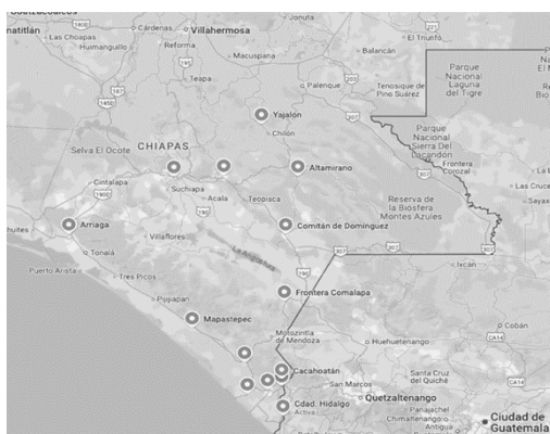
Mapa 4. Zonas de tolerancia en Chiapas