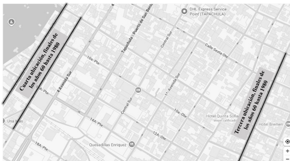
Mapa 2. Desarrollo de las zonas rojas en Tapachula, 1960-1980

Tercera ubicación: desde finales de los años sesenta hasta los ochenta se encontraba a lo largo de la 5a. Avenida Sur desde la 16a. Oriente. Cuarta ubicación: también desde los años sesenta hasta los ochenta, se encontraba por la 8a. Avenida Sur y la 6a. Avenida Sur; cruzaban las vías del ferrocarril y se ingresaba a la zona por la 4a. Avenida