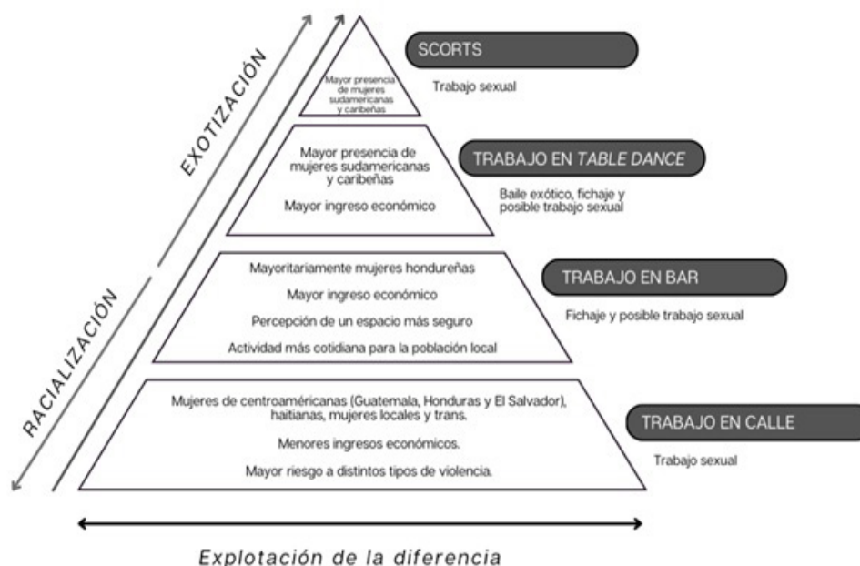
Ilustración 1. Pirámide de trabajo sexo-erótico en Tapachula