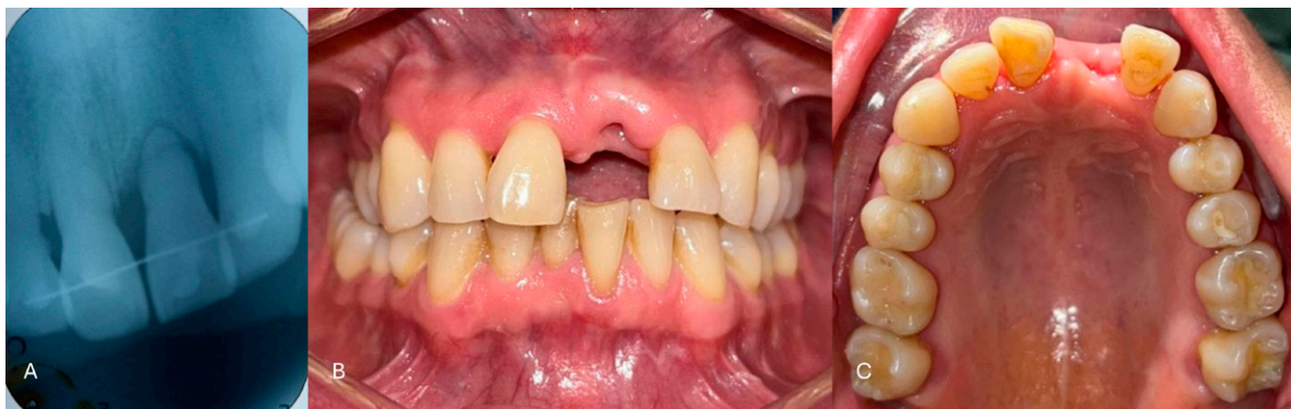
Figura 1. Fotografías iniciales. A. Radiografía dentoalveolar; se observa colocación de férula con alambre y resina; B. Fotografía intraoral de frente mostrando el avance de la cicatrización post-extracción. C. Fotografía oclusal de la zona.

padecer patologías cardiovasculares, respiratorias, gastrointestinales, luéticas, fímicas, renales, hematológicas, endocrinas, autoinmunes, metabólicas, genéticas, psicológicas, enfermedades de transmisión sexual (ETS), transfusiones y alergias. La paciente refirió movilidad y molestia al masticar en el diente 21, con evolución de tres años, informando un traumatismo ocurrido aproximadamente hace 10 años. Clínicamente se observó férula con alambre y resina, colocada tres años atrás. El diente 21 presentó movilidad grado III con reabsorción radicular al examen radiográfico y pérdida de inserción ósea; el diente 11 presentó movilidad grado I y el diente 12 sin movilidad ni datos patológicos (Figura 1. A). Como diagnóstico del diente 21 utilizando el CIE-11 se concluye necrosis pulpar (DA09.1), consecuente pérdida por traumatismo y enfermedad periodontal focal (DA0A.1).