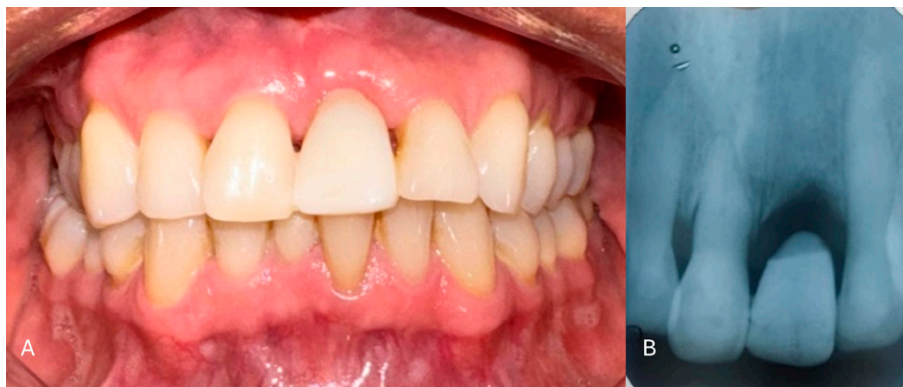
Figura 3. Final. A. Fotografía clínica tras un mes de evolución postoperatoria. Se puede apreciar que el contorno gingival del diente 21 se ha mantenido conservando las papilas; B. Radiografía dentoalveolar de la región operatoria. Se muestra la forma del pónico oval.