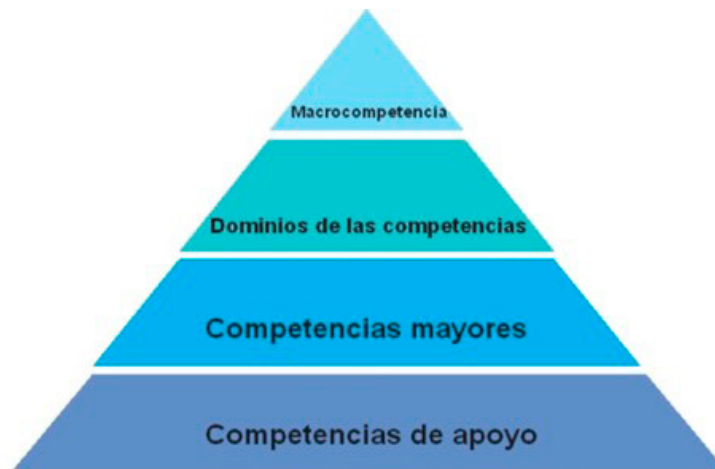
Figura 1. Jerarquía de las categorías empleadas. (2)

cotidiano de la práctica odontológica general 14 y/o especializada y son: 1. Pensamiento crítico, 2. Profesionalismo, 3. Administración de la práctica odontológica, 4. Comunicación, 5. Prevención, promoción y educación para la salud, 6. Diagnóstico, 7. Pronóstico, 8. Plan de tratamiento y 9. Tratamiento 2 . Una competencia mayor representa “la capacidad de realizar una tarea compleja o prestar un servicio determinado”. Cada dominio tiene una o más competencias mayores 2 . Las competencias de apoyo son “capacidades más específicas, las cuales se podrán considerar subdivisiones de la competencia mayor”. El adquirir una competencia mayor requiere demostración de dominio de todas las competencias de apoyo por parte de los futuros odontólogos y/o especialistas 2 .