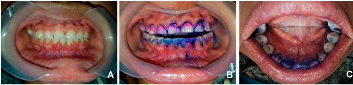
Figura 1. A) Se observa una inflamación de grado 2, según el índice de Løe y Silness, en todo el margen gingival de los dientes maxilares y, en los dientes mandibulares se muestra una inflamación de grado 3 del tejido gingival, de los dientes 33 al 44. El resto del tejido gingival de los dientes mandibulares muestra una inflamación de grado 2 (dientes: 37, 36, 35, 34, 45, 46 y 47). B) Hay abundante placa de alto riesgo (azul claro, con \text{pH} < 4,5 ), placa antigua (azul, > 48 h) y placa nueva (rosa) en dientes, surcos y márgenes gingivales. C) Presencia de placa dental en la cara lingual de los dientes mandibulares, principalmente en los incisivos.

La solución salina al 0.9% se emplea comúnmente durante los procedimientos de raspado y alisado radicular (RAR). Sólo sirve para remover material biológico contaminado, porque carece de efectos antimicrobianos, antiinflamatorios y cicatrizantes 21, 22 .