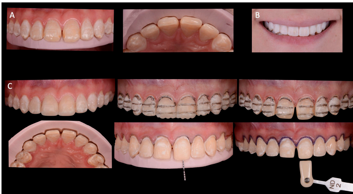
Figura 2. Guía de reducción, mock up , proceso de reducción dental y toma de color. A) Vista vestibular de la guía de reducción en boca y vista incisal de la guía de reducción a nivel de tercio medio. B) Frontal sonriendo con mock up . C) Fotografías intraorales del proceso de la reducción dental y de la toma de color mock up realizado de segundo premolar a segundo premolar, tallado de surcos guías de preparación sobre el mock up y marcados con grafito, surcos guías marcados sobre los dientes una vez retirado el mock up , corroboración de la reducción dental con la guía de reducción desde una vista incisal a nivel de tercio incisal, reducción dental de 1 mm desde una vista vestibular corroborado con sonda y con la guía de reducción y toma de color de muñón con colorímetro. Para la selección de la opacidad de la vidriocerámica se utilizó la aplicación Shade Navigation App.

Sobre el mock up se prepararon surcos de reducción a una profundidad de 0.3 mm con una fresa BR-45 (Mani® dia-burs®, Mani Inc., Japón) se retiró el mock up y sobre los dientes quedaron registrados los surcos guía, los cuales fueron señalados con un grafito. Continuando con la preparación se utilizó una fresa TR-13 (Mani® dia-burs®, Mani Inc., Japón) para realizar el desgaste a la profundidad indicada (0.3 a 0.6 mm), lo cual se corroboró con las guías de reducción. El acabado superficial de la preparación se realizó mediante el uso de fresas TR-13F, TR-13EF (Mani® dia-burs®, Mani Inc., Japón), discos Sof-Lex y hules para pulir (3M™ Sof-Lex™ Finishing Strips Basic Kit, 3M espe Deutschland GmbH, Alemania), la terminación marginal quedó a nivel equigingival. Una vez concluida la preparación, se utilizó la técnica de retracción gingival de doble hilo 9 , el primer hilo del #000 negro y un segundo hilo del #0 morado (Ultrapak™ y Ultrapak™ E, Ultradent Products Inc., South Jordan, Utah, Estados Unidos), para la selección de la opacidad de la vidriocerámica se utilizó la aplicación Shade Navigation App (IPS e.max Shade Navigation App, Ivoclar Vivadent AG, Liechtenstein) (Figura 2. C).