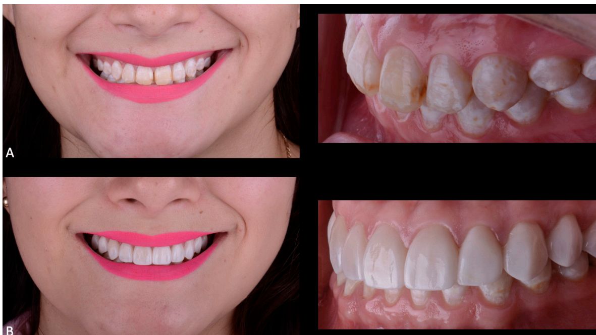
Figura 4. Fotografías faciales e intraorales iniciales y finales A) Frente sonriendo y lateral \frac{3}{4} intraoral inicial. B) Frente sonriendo después de la cementación de las carillas y lateral \frac{3}{4} intraoral después de la cementación de las carillas

Al cumplirse los objetivos planteados se mejoró la estética dental del sector anterior; la arquitectura gingival al sonreír fue más armónica; se cubrieron las discromías causadas por la fluorosis; se le dio una mejor forma y proporción en tamaño a los dientes; el diastema que existía se cerró; la línea de la sonrisa fue alineada siguiendo la curvatura del labio inferior; se logró hacer coincidir la línea media facial con la línea media dental y se obtuvo el establecimiento de características de oclusión orgánica (Figura 4. A-B).