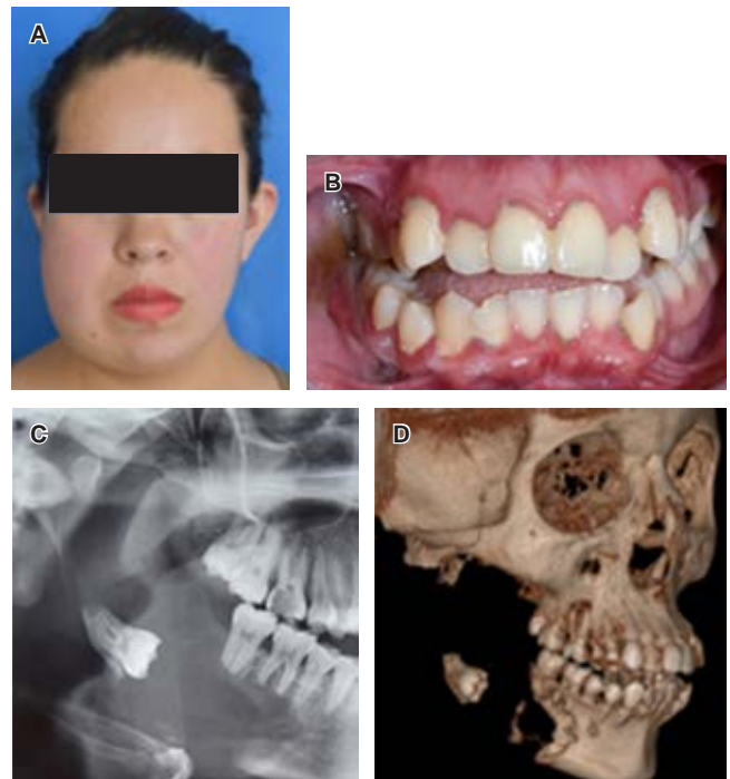
Figura 1: Clínica e imagenología inicial. A) Fotografía frontal inicial con aumento de volumen en tercio medio e inferior facial derechos. B) Fotografía en oclusión inicial con lesión traumática en mucosa yugal. C) Ortopantomografía inicial con tercer molar asociado a lesión radiolúcida, con presencia de rizoclasia de órganos dentales 46 y 47. D) Reconstrucción tomográfica en 3D, con pérdida ósea de cuello condilar, proceso coronoides, rama, ángulo y cuerpo mandibular derechos.

Mujer de 22 años de edad, con aumento de volumen progresivo y asintomático de siete meses de evolución en región de tercio medio e inferior facial derecho, en la ortopantomografía y la tomografía axial computarizada se aprecia imagen radiolúcida de forma irregular, que mide 10 × 8 × 4 cm, con bordes escleróticos bien delimitados en rama mandibular, presenta perforación de la cortical vestibular, ángulo y cuerpo mandibular derechos con un tercer molar desplazado al borde inferior del cuerpo mandibular ( Figura 1 ).