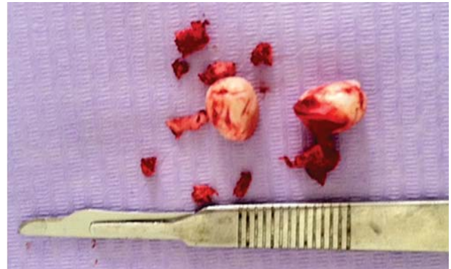
Figura 3. Enucleación de odontomas.

Hisatomi et al, en el año 2002 analizaron 107 casos de odontomas, sus resultados arrojaron una mayor in-