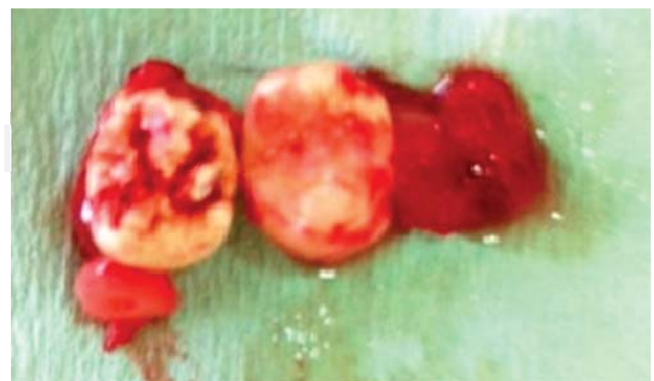
Figura 4. Exodoncia de supernumerarios mandibulares, en zona de premolares.