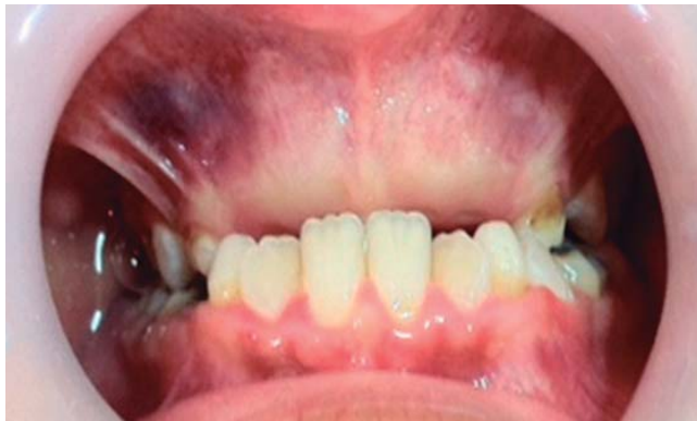
Figura 1. Apariencia clínica del sector anterosuperior inicial.

có como diagnóstico presuntivo odontomas compuestos y órganos dentarios supernumerarios respectivamente, para los cuales, se realizó anestesia local con carpules de lidocaína 2% (1:80,000) y abordaje quirúrgico con bisturí tipo Bard-Parker N° 3, enucleación completa de las lesiones tumorales con pinza gubia, elevadores recotopical, exodoncias de supernumerarios con elevadores angulados, síntesis con aguja y sutura no reabsorbible; para el postoperatorio, se prescribieron fármacos antiinflamatorios y remisión a la Especialidad de Ortodoncia y Ortopedia Maxilar, asimismo, fueron dadas recomendaciones a su madre; ulterior al mencionado procedimiento, el diagnóstico es sustituido por odontomas complejos, debido a sus características morfológicas y posterior examen histológico confirmatorio, además la corroboración de supernumerarios ( Figuras 3 y 4 ). Microscópicamente, la lesión estaba constituida por una mezcla desordenada de tejidos dentarios, en los que se identificaba dentina, esmalte, tejido pulpar y cemento,