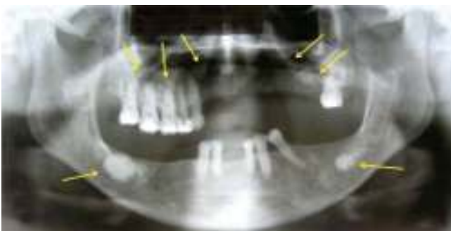
Figura 3. Ortopantomografía dental sinusal donde se observan múltiples imágenes radiopacas circulares, delimitadas, que involucran los cuatro cuadrantes (flechas). En el cuerpo mandibular derecho se observa una imagen radiopaca rodeada por una imagen radiolúcida que se extiende en toda la porción basal de la lesión compatible con proceso infeccioso.

(Figura 4) de la lesión con limpieza quirúrgica del lecho en donde se obtuvo una muestra de tejido duro similar a tejido óseo de un tamaño de 1.5 cm aproximadamente (Figura 5), se culmina la síntesis de tejidos con sutura Nylon 4-0. Se indicó tratamiento con azitromicina 500 mg c/24 horas por tres días.