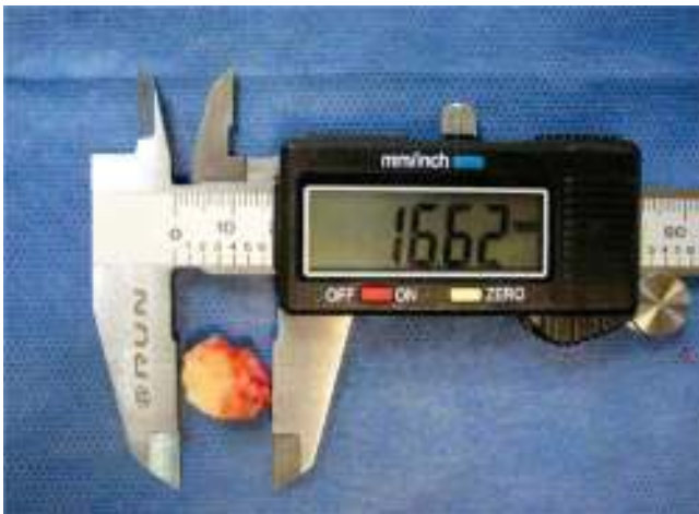
Figura 5. Muestra de tejido duro similar a tejido óseo de un tamaño de 1.5 cm aproximadamente.

La DOF presenta características en cuanto a edad, género y etnia, observándose con mayor frecuencia en mujeres de mediana edad de afinidad étnica negra. La población Venezolana es heterogénea, considerada por muchos como el país con la mayor mezcla étnica en América. El caso presentado anteriormente