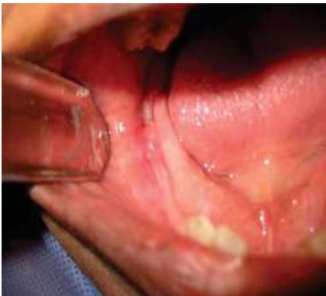
Figura 2. Fotografía clínica intraoral de lesión hiperémica con presencia de fístula.

Bajo anestesia local infiltrativa con lidocaína al 2% y epinefrina 1:100.000 se realizó biopsia excisional