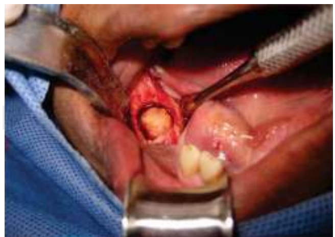
Figura 4. Fotografía clínica intraoperatoria de osteotomía periférica para realización de biopsia excisional de la lesión.

El diagnóstico de la DOF ha sido motivo de controversia con el pasar de los años, según la OMS el mismo debe ser obtenido a través de la realización de estudio histopatológico. 1 La DOF se considera una lesión con características clínico-radiográficas particulares que en la mayoría de las ocasiones permite el diagnóstico clínico. Existen diversos autores como Gündüz K et al 13 quienes refieren que en muchos casos el diagnóstico se realiza mediante evaluación clínica, edad, género y grupo étnico, además de la evaluación imagenológica, ya que este tipo de lesión