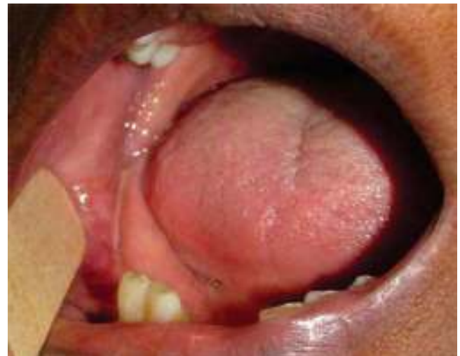
Figura 7. Fotografía clínica intraoral sin presencia de aumento de volumen ni cambio de coloración a nivel de la mucosa.

Radiográficamente se distinguen masas radiopacas difusas en las regiones alveolares de múltiples cuadrantes, las cuales juegan un papel importante en el diagnóstico. Las lesiones se encuentran generalmente en cercanía a los órganos dentarios. El aspecto radiológico, aunque no patognomónico, es muy carac-