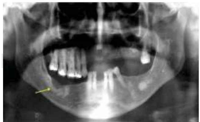
Figura 8. Ortopantomografía dental sinusal donde se observa zona operada con regeneración ósea adecuada (flecha) y resto de lesiones sin cambios de tamaño.