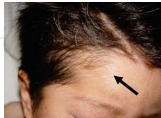
Figura 6. Zona de alopecia probablemente traumática.