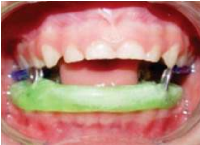
Figura 12. Utilización del aparato Spring Bite Woodside como parte de la terapia funcional posterior a la artroplastia.

de los casos, laceraciones orales en el 14% y fracturas mandibulares en el 11%. 6 En nuestro caso no existieron traumatismos dentales pero sí daño en la ATM derecha y tomando en cuenta las múltiples fracturas en extremidades no se descarta que la desviación y limitación a la apertura sea una secuela de un antecedente de trauma facial.