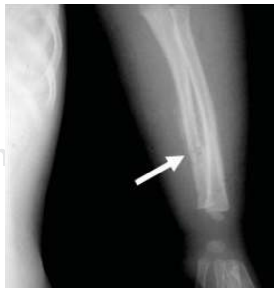
Figura 2. Fractura de radio izquierdo.