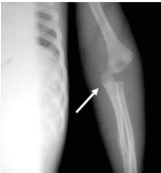
Figura 1. Luxación de codo izquierdo.

Al momento de llevar a cabo la exploración intraoral el menor manifestó dolor a la apertura bucal. Se observó una limitación a la apertura con una máxima de 17 mm y ligera desviación mandibular hacia el lado derecho, por lo que la exploración sólo se llevó a cabo con una lámpara externa logrando visualizar dentición