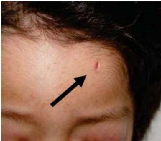
Figura 7. Cicatriz en región frontal de lado izquierdo.

Los objetivos de dicho protocolo son conseguir una apertura bucal máxima idónea, lograr movilidad y función satisfactorias de la articulación y obtener simetría facial con oclusión armónica. Todo esto se llevó a cabo mediante dos fases que fueron: