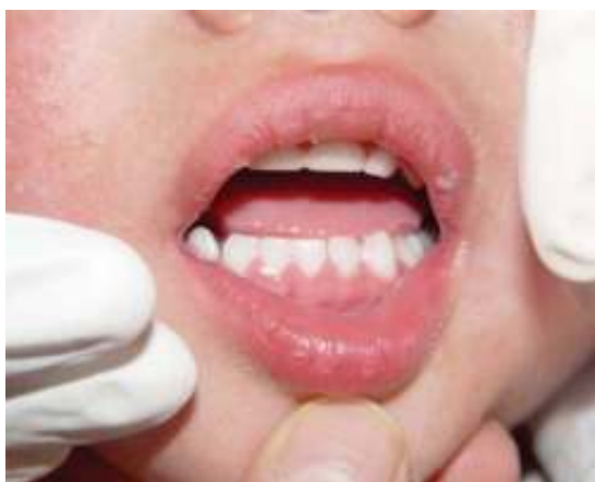
Figura 8. Apertura máxima durante la exploración intraoral con ligera desviación derecha.