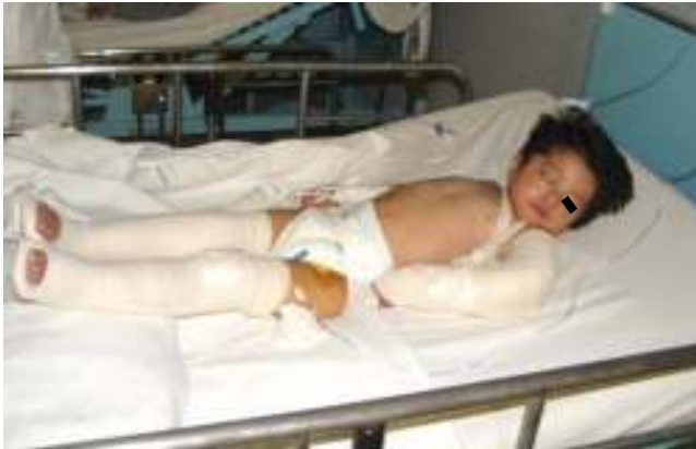
Figura 3. Paciente con fijación de fracturas en extremidades superiores e inferiores.

Es importante mencionar que la hospitalización del paciente se lleva a cabo por tres objetivos: a) brindar de inmediato atención médica; b) separar al niño del probable agresor(a), evitando así que siga siendo víctima de maltrato; y c) realizar las investigaciones pertinentes por parte del servicio de tra-