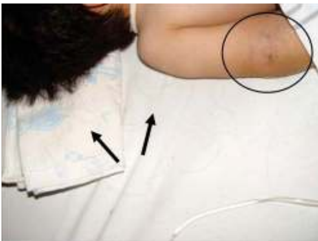
Figura 4. Caída de cabello y huellas de hematomas en diferentes etapas de cicatrización.