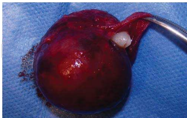
Figura 5. Lesión delimitada, con presencia de canino permanente en su interior, de aproximadamente 4 x 4 cm.