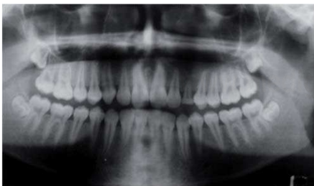
Figura 7. Ortopantomografía postoperatoria un año, tres meses, neumatización normal del seno maxilar, canino decíduo en posición y función, sin datos de recidivas.