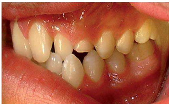
Figura 2. Ausencia de canino permanente, aumento de volumen, sin datos de infección.

Mediante anestesia general inhalatoria balanceada, con intubación oro traqueal, previa asepsia y antisepsia de la región facial con yodopovidona, previa colocación de taponamiento faríngeo y campos estériles, se infiltra xilocaína con epinefrina al 2% a nivel de nervio infraorbitario izquierdo, se realiza incisión semilunar, apical a los dientes 22, 63, 24, 25 con hoja de bisturí 15, se desperiostiza, obteniéndose colgajo mucoperióstico observándose pared anterior de seno maxilar sin perforación, sólo adelgazamiento de la cortical vestibular, por lo que se realiza osteotomías para exponerse la tumoración ( Figura 4 ); el cual se palpa de consistencia firme, no desplazable, bien delimitada, ocupando el seno maxilar en su totalidad;