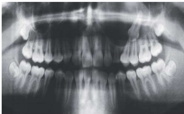
Figura 3. Ortopantomografía prequirúrgica, órgano dentario mesioangulado relacionado con la lesión la cual ocupa el seno maxilar, sin datos de reabsorción radicular.

realizándose mediante disección roma la enucleación completa, observándose en el interior de la tumoración el canino superior izquierdo. Posteriormente se curetea seno maxilar y lavado del mismo con solución fisiológica 0.9%. El afrontamiento de los bordes de la herida se realiza mediante sutura de ácido poliglicólico 3-0; se decide conservar canino de la primera dentición para que ocupe el lugar del permanente. Se retira tapón faríngeo, terminándose el procedimiento sin complicaciones ( Figura 5 ).