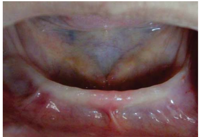
Figura 5. Control a las 24 horas del procedimiento quirúrgico.

Transcurridos los 18 días se realiza el tercer control en donde se observa tejido completamente cicatrizado, en óptimas condiciones para tomar las impresiones preliminares y registro para la prótesis total, en el sector anterior y posterior del vestíbulo una recuperación de 6 y 4 mm de profundidad respectivamente ( Figura 6 ). Finalmente se rehabilita el paciente con prótesis totales bimaxilares a los 28 días de la cirugía,