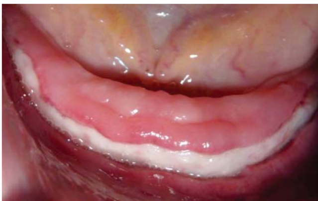
Figura 1. Rebordes alveolares inferiores con avanzada reabsorción ósea.

Al examen estomatológico se observa ausencia clínica de todos los órganos dentarios, reborde alveolar superior grueso y con altura óptima; rebordes inferiores colapsados y con avanzada reabsorción (Figura 1). La