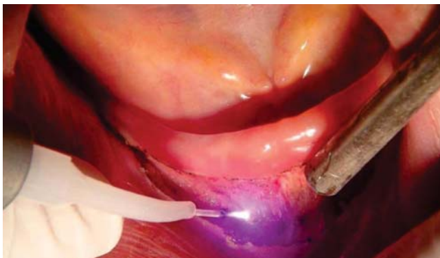
Figura 4. Aplicación de láser de baja intensidad para efecto bioestimulante.

Se realiza primer control a las 24 horas, en donde se observa ausencia de edema y al aplicar valoración del dolor con escala EVA, de 0 a 10, el paciente refiere un puntaje de tres, se procede a realizar una segunda aplicación del láser terapéutico ( Figura 5 ). Para el día ocho se realiza un segundo control, con notable recuperación y ausencia de dolor, posteriormente se instaura tercera aplicación de láser terapéutico.