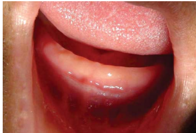
Figura 6. Recuperación de profundidad en rebordes alveolares inferiores.

a la evaluación durante los controles no se refirió molestia.