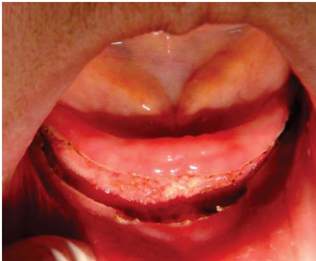
Figura 3. Resultado de la aplicación de láser quirúrgico.