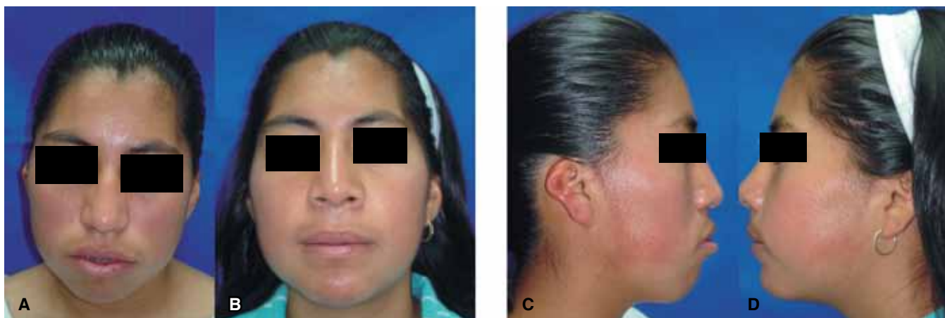
Figura 7 A, B, C, D. Vista frontal y lateral comparativa prequirúrgica y postquirúrgica.