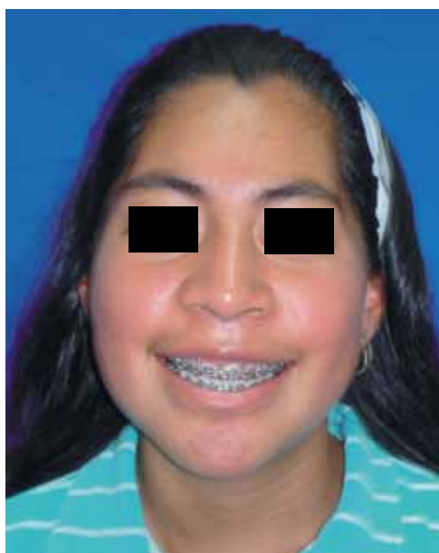
Figura 9. Resultados estéticos y armonía facial.

opción más de tratamiento sin consecuencias de necrosis o mala unión de segmentos óseos, ya que se preserva la irrigación de la arteria palatina anterior y esfenopalatina, a diferencia de las técnicas que utilizan incisiones sagitales o parasagitales palatinas para la realización de osteotomías segmentarias con las cuales presentan dehiscencias de heridas por no contar con un adecuado control higiénico durante la fijación interdentalomaxilar, 16 además de existir la posibilidad de presentar fístulas nasopalatinas por mala coaptación ósea.