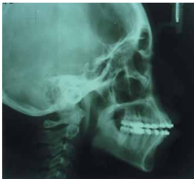
Figura 3. Radiografía lateral de cráneo con cefalostato.