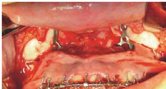
Figura 6. Osteosíntesis con miniplacas.

nes y evitar o disminuir aporte vascular, se termina osteotomía sagital o parasagital de paladar con cincel de 4 mm según el caso, se realiza impactación de premaxila de 3 mm a 5 mm adaptando septum nasal con desgaste óseo y recorte de septum cartilaginoso y rotación posterior de segmento anterior maxilar de 4 mm a 6 mm hasta obtener íntimo contacto de segmentos óseos sin utilización de injertos para corrección de protrusión dental; en tres casos fue necesaria la realización de turbinectomía inferior bilateral para evitar obstrucción o disminución de vía aérea, 11,12 se realizaron osteotomías sagitales mandibulares para avance en 7 casos, en dos casos osteotomías subapicales anteriores y en un caso osteotomía segmentaria anterior mandibular, todas las cirugías mandibulares fueron acompañadas con mentoplastia de avance, en los casos de osteotomías subapicales se conservó una laja ósea de 5 mm de grosor para conservar vascularidad ósea y disminuir riesgos de necrosis. 13-15 Todas las osteotomías fueron fijadas con miniplacas