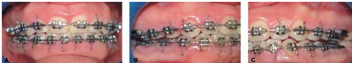
Figura 2A. Oclusión prequirúrgica. B. Oclusión molar derecha. C. Oclusión molar izquierda.

Se utilizó la técnica de segmentación maxilar en tres piezas en 17 pacientes y dos piezas en 3 pacientes, 6,7 los primeros premolares superiores fueron extraídos bilateralmente. Se realizó osteotomía maxilar horizontal con sierra recíprocante ( Figura 4 ) y disyunción pterigomaxilar con cincel curvo por vía intraoral en los casos de segmentación en 3 piezas, la osteotomía vertical ( Figura 5A, B, C ) se realizó a través del alvéolo de los órganos dentarios extraídos previa desperiostización de paladar, 8-10 se protege mucosa palatina y nasal para evitar desgarros o perforacio-