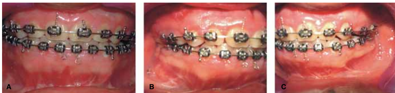
Figura 8 A. Oclusión postquirúrgica. B, C. Oclusión postquirúrgica bilateral.