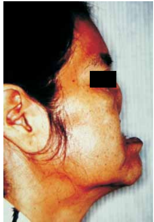
Figura 2. Vista de perfil de paciente con maxilectomía y etmoidectomía total.