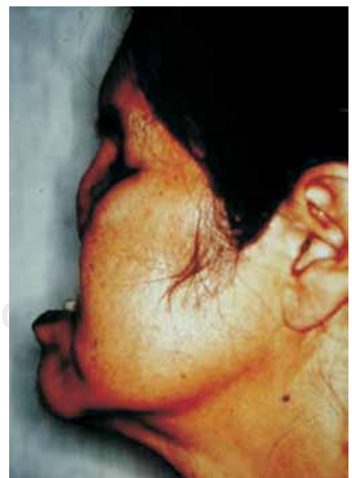
Figura 3. Vista de perfil en la cual se observa rinectomía parcial y exenteración orbitaria.