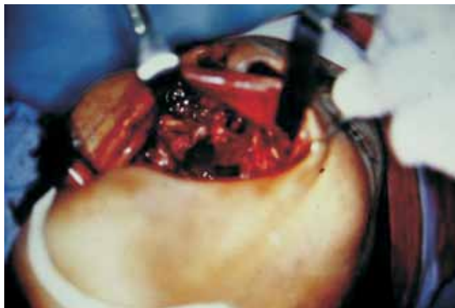
Figura 4. Procedimiento quirúrgico en el que se realiza el descolapso del tercio medio facial de la cara.