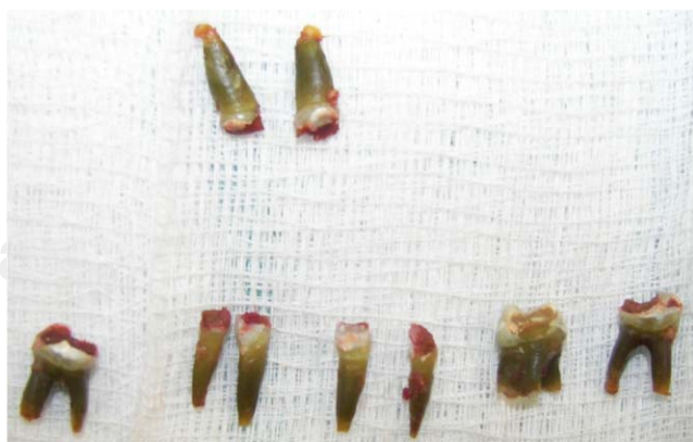
Figura 3. Órganos dentarios extraídos donde se aprecia la coloración verde de las raíces (Para fotografía a color consultar la versión electrónica).

Una vez evaluado el estado de salud del paciente por medio de las valoraciones de los diversos Servicios tratantes, fue valorado por el Servicio de Aneste-