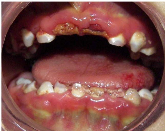
Figura 2. Imagen intraoral de los múltiples procesos cariosos que presenta el paciente y la coloración verde de los órganos dentarios (Para fotografía a color consultar la versión electrónica).

Se interconsulta al Servicio de Estomatología por presentar múltiples procesos cariosos, los cuales representan focos infecciosos (Figura 2). Debido al compromiso sistémico y tratamiento bucal extenso es candidato para realizar rehabilitación bucal bajo anestesia general (RBBAG) se interconsulta a los Servicios tratantes del paciente quienes no contraindican la RBBAG.