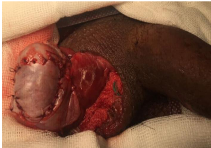
Figura 3. Testículo derecho. Vista transoperatoria de testículo derecho reconstruido con injerto autólogo de túnica albugínea de testículo contralateral, posterior a debridación de tejido no viable

Por lo que decidimos realizar orquiectomía simple izquierda y en testículo derecho debridación de tejido no viable y orquiectomía parcial. Se resecó un tercio del polo inferior, así como toma y aplicación de injerto autólogo de túnica albugínea de testículo contralateral y reconstrucción con monofilamento absorbible puntos simples como se aprecia en la figura 3.