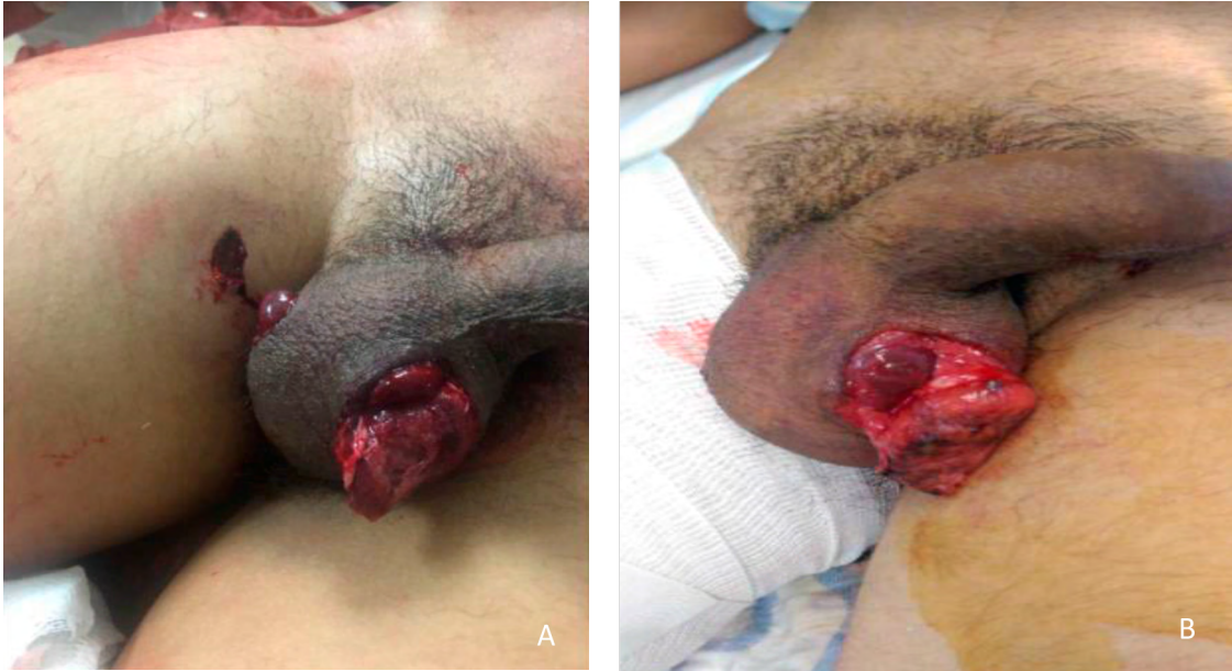
Figura 1. Orificios de entrada y salida del proyectil de arma de fuego (A), avulsión testicular izquierda (B)

Región perineal sin equimosis ni aumento de volumen o lesiones aparentes. El miembro pélvico derecho con rotación externa forzada y deformidad asociada, con orificio del proyectil de arma de fuego en tercio superior del muslo. Los resultados de laboratorio dentro de parámetros normales. En la radiografía de miembros pélvicos se encontró fractura de fémur derecho desplazada y cabalgada.