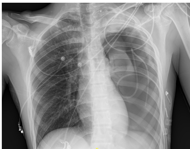
Figura 3: Rx tórax portátil en decúbito: colapso pulmonar izquierdo por neumotórax en estudio actual del 65% según el índice de Light, con desplazamiento mediastínico hacia hemitórax derecho.