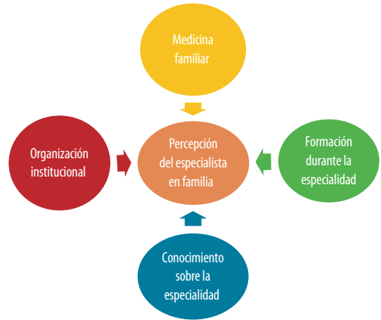
Figura 2. Categorías obtenidas de las entrevistas realizadas a los médicos familiares sobre la percepción de su especialidad.

E6 «Porque nosotros vemos todas las edades, en general a toda la población, eso en su mente es de médicos generales». E7 «No, porque tienen idea de que todos los médicos de primer nivel somos médicos