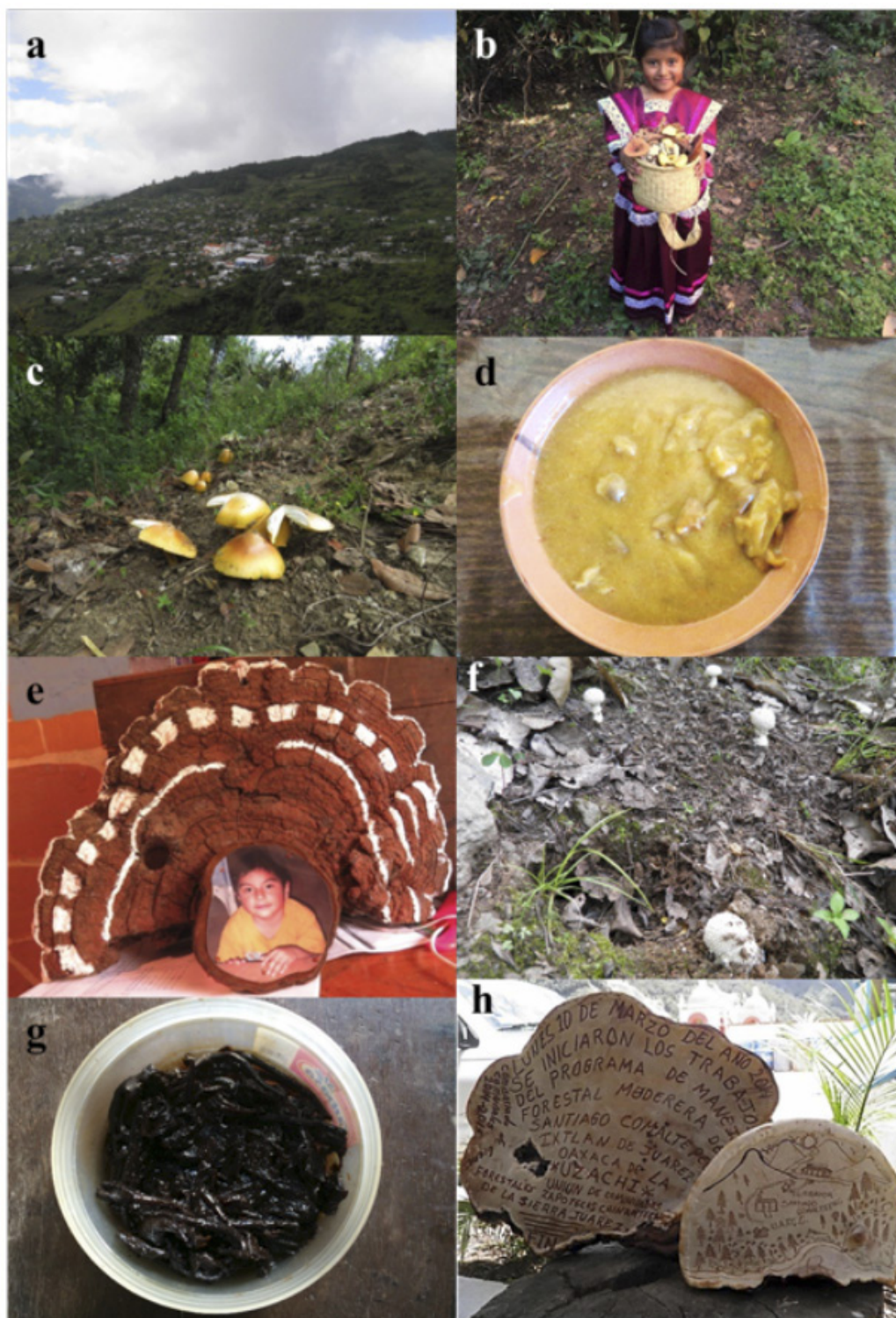
Figura 2. Uso de los hongos silvestres comestibles en la comunidad chinanteca de Santiago Comaltepec, Oaxaca. a) Vista panorámica de Santiago Comaltepec. b) Niña chinanteca sosteniendo un tenate con hongos comestibles. c) Amanita basii Guzmán et Ram.-Guill. en bosque de Quercus spp., su hábitat natural. d) “Amarillo de hongos”, el platillo más valorado en Santiago Comaltepec. e) Portarretratos hecho con Ganoderma sp., el cual se pinta y asemeja a la cola de un guajolote. f) Amanita sp. con escamas piramidales, en bosque de encino, considerada tóxica en la comunidad. g) Hongos alucinógenos en miel utilizados en la medicina tradicional chinanteca. h) Frases y dibujos realizados en el himenio de Ganoderma applanatum (Pers.) Pat., el cual se encuentra en las oficinas del comisariado de bienes comunales de la localidad de estudio.