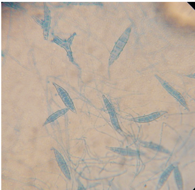
Figura 3. Aspecto microscópico de Microsporium audouinii .

macroconidios fusiformes de doble pared, de extremos afilados, con o sin equinulaciones. Miden de 7-20 µm de ancho por 30-60 µm de largo y presentan entre 6 y 12 septos, aunque Rippon refiere que pueden ser hasta quince.