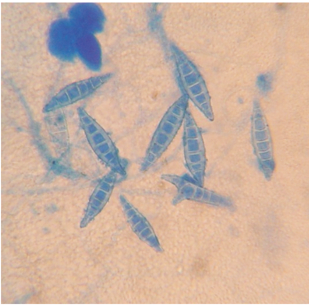
Figura 1. Aspecto típico de macroconidios de Microsporium canis .