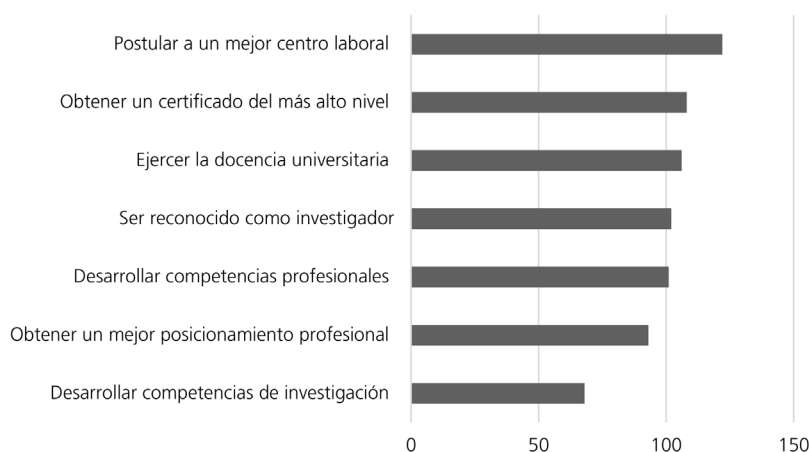
FIGURA 3 Motivaciones de los estudiantes para optar por un doctorado en educación (T=137)