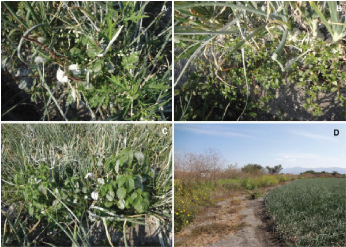
Figura 3. Arvenses interactando dentro y fuera del cultivo de cebolla ( Allium cepa ). A) Escoba amarga ( Parthenium hysterophorus ); B) Verdolaga ( Portulaca oleracea ); C) Plantas de acalifa ( Acalypha ostryifolia ); D) Acahual o falso girasol ( Tithonia tubiformis ) en el borde del cultivo de cebolla.

por Velásquez-Valle et al. (2013) (Cuadro 2). En México, al menos 14 especies de arvenses son hospedantes de T. tabaci y estos se han reportado como hospedantes de IYSV en México y zonas fuera del país (Cuadro 2).