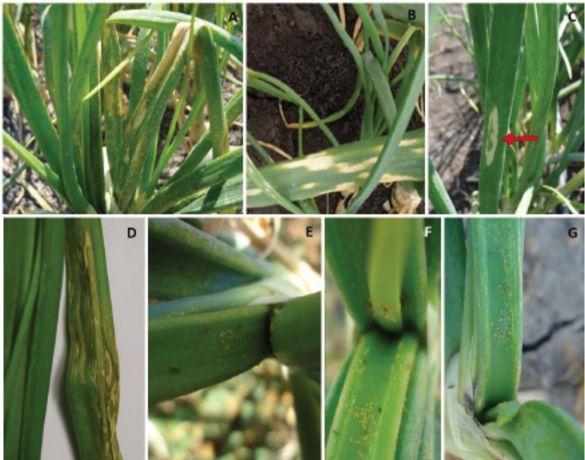
Figura 2. A y B) Síntomas asociados a la infección de Iris yellow spot orthotospovirus consistentes en lesiones cloróticas de color blanco pajizo en forma elongada; C y D) Lesiones cloróticas de color blanco pajizo con presencia de una isla verde en el centro de la lesión; E-G) Presencia de altas poblaciones de T. tabaci (inmaduros y adultos) en el cultivo de la cebolla.

estas lesiones se observan en la parte interna de las hojas próximas al bulbo, donde los trips prefieren alimentarse (Figuras 2 E-F). Cuando las lesiones del virus coalescen, las hojas colapsan y se reduce el área fotosintética (Kritzman et al. , 2001), afectando la formación del bulbo (Gent et al. , 2006) e inclusive causa la muerte de la planta cuando el daño es severo (Weilner y Bedlan 2013). Los síntomas son más frecuentes cuando la planta se encuentra en edad avanzada o en la formación del bulbo (Weilner y Bedlan, 2013). Los síntomas reportados en el cultivo de cebolla en México, son similares a los reportados en otros países, lesiones cloróticas, amarillentas o blancas, secas y alargadas (Figura 2A y 2B) (Ramírez-Rojas et al. , 2016), y en ocasiones se observa una isla verde en el centro de la lesión (Figura 2 C y D) (Ávila-Alistac et al. , 2017).