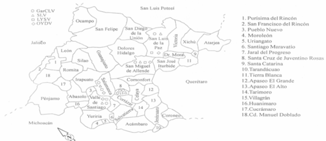
Fig. 1. Distribución de los virus GarCLV, SLV, LYSV y OYDV detectados en el follaje del cultivo de ajo ( Allium sativum ), en cinco municipios del estado de Guanajuato, México, durante el ciclo otoño-invierno 2004-2005.

Fechas de evaluación y colectas. La detección se realizó en dos fechas para las colectas de San Miguel de Allende, San Luis de La Paz y Valle de Santiago y en tres fechas para las de Salamanca y Villagrán, Guanajuato, México (Fig. 1). Las colectas se llevaron a cabo durante los meses de enero a marzo del 2005, hasta llegar a un total de 176 muestras de hojas de plantas de ajo con síntomas presuntivos de una virosis, por ejemplo: enchinamiento y/o enrollamiento, mosaico, deformación de hojas, amarillamiento y ampollamiento, bandeado y enanismo. También, se colectaron 19 muestras de tejido vegetal de plantas de ajo aparentemente sanas, en 12 localidades de municipios del estado de Guanajuato: En la zona norte, Altamira 1, Monte Cristo 2 y Marilu 2, Los Rodríguez de San Miguel de Allende y El Ramillete de San Luis de La Paz; en la zona centro, Santa Teresa 3 y Santa Teresa 4, Valtierra de Salamanca y Pozo Alto 1, Pozo Alto 2, Laurel 1, San Daniel, Bodegas, El Pato, de Villagrán y Rancho El Jabonero, de Valle de Santiago, en la zona centro-sur. El número de muestras totales colectadas por municipios fueron: 40 en San Miguel de Allende, 15 en San Luis de La Paz, 30 en Salamanca, 70 en Villagrán y 40 en Valle de Santiago, con un número total de 195 muestras. Una vez colectadas, las muestras se colocaron en bolsas de plástico y mantuvieron en congelación (-20 °C) hasta el momento de su procesamiento.