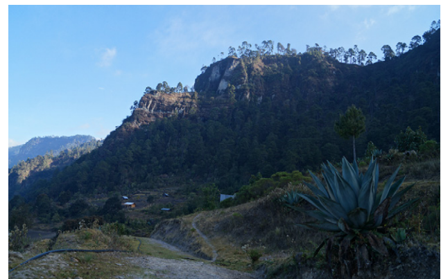
Figura 5. Hábitat de Echeveria andreae J. Reyes y L.E. Cruz-López, en bosque de Pinus-Quercus de la localidad tipo.

Facultad de Arquitectura de la Universidad Nacional Autónoma de México, quien ubicó por primera ocasión la localidad tipo de la nueva especie y por su interés en el rescate y conservación de plantas, especialmente de Chiranthodendron pentadactylon Larreat., y de las especies utilizadas en los jardines prehispánicos.