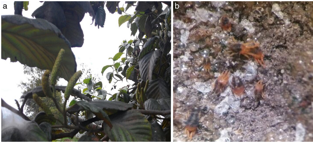
Figura 1. Aspecto general de hojas de Alnus acuminata mostrando síntomas de alimentación de O. coffeae (a); colonia de Oligonychus coffeae sobre hojas de A. acuminata (b).