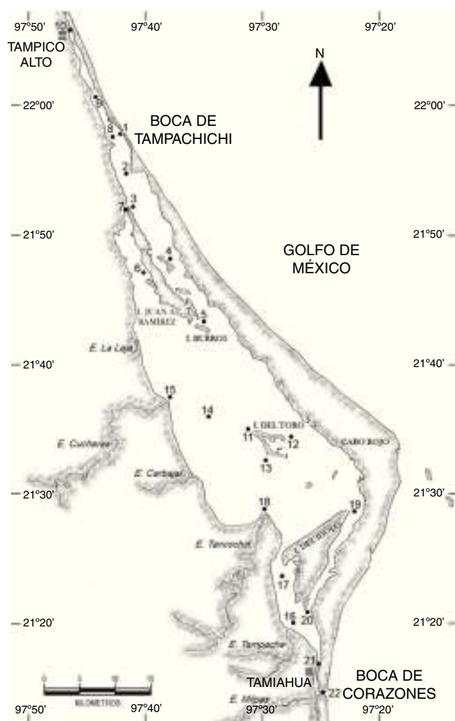
Figura 1. Área de estudio y ubicación de estaciones de muestreo en la laguna de Tamiahua, Veracruz, México (2011).

utilizó el índice de valor de importancia (IVI) (Krebs, 1985). Por otro lado, se relacionó la densidad de las especies dominantes con la temperatura y la salinidad del agua a través de la correlación de rangos de Spearman (Zar, 2010).