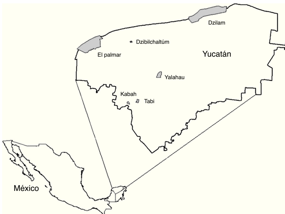
Figura 1. Ubicación de las áreas naturales protegidas de competencia estatal en Yucatán, México.