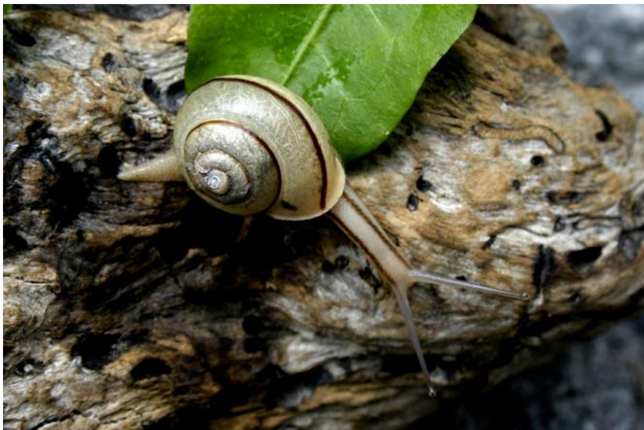
Figura 1. Tryonigens remondi (Tryon, 1863), familia Helminthoglyptidae CNMO 2829 Guerrero, Las Juntas cerca de Acahuizotla, Col. Felipe Noguera, 2 agosto 2008.

Los moluscos pueden tener o no tener concha, o tener concha interna reducida. La concha está constituida por cristales de carbonato de calcio en forma de aragonita (Solem, 1974), además es la estructura protectora del molusco y es altamente diversa en morfología y ornamentación (Solem, 1974; Barker, 2001). La concha puede ser discoidal, globosa, coniforme, turriiforme, en forma de huso o de pupa. Unas son relativamente delgadas (terrestres), muy delgadas (pulmonados dulceacuícolas) o fuertes (prosobranquios terrestres y dulceacuícolas). El color de la concha tiende a ser claro en las especies que habitan en sitios muy soleados, lo cual les permite disipar la energía y refrescarse (Burch y Pearce, 1990), de un solo color en especies que habitan el suelo y las arborícolas tienen patrones de coloración con líneas o vetas (Thompson, 1987).