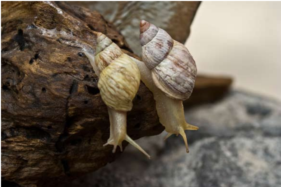
Figura 3. Drymaeus (Mesembrinus) sulcosus (Pfeiffer, 1841), familia Orthalicidae CNMO 3447 Distrito Federal, Desierto de Los Leones, ca. 2 km de La Venta hacia el convento, a los lados de la carretera. Col. E. Naranjo García, 11 agosto 2010.