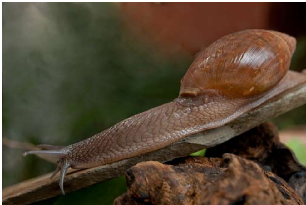
Figura 4. Euglandina (Euglandina) vanuxemensis (Lea, 1834), familia Spiraxidae CNMO 4666, estado de Morelos, Tepoztlán. Col. William López Forment, 19 octubre 2011.