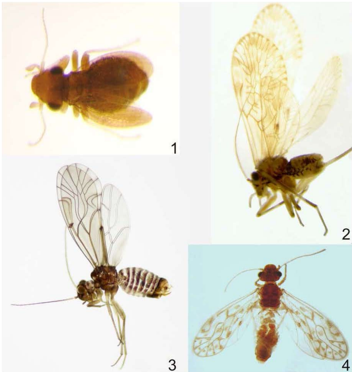
Figuras 1-4. Algunos psocópteros de México. 1, Rhyopsoculus mexicanus García-Aldrete, Chamela, Jalisco. 2, Goja reticulata Casasola y García-Aldrete, Omiltemi, Guerrero. 3, Lachesilla tropica García-Aldrete, Ocozocoautla, Chiapas. 4, Garcialdretia veracruzensis Mockford, Los Tuxtlas, Veracruz.