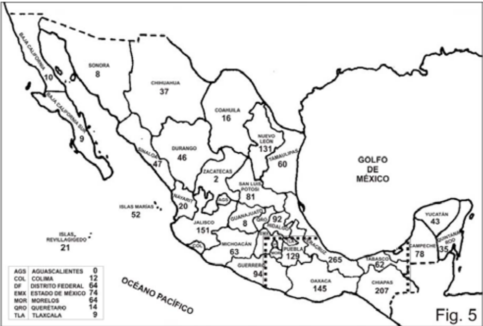
Figura 5. Número de especies de Psocoptera en cada estado de México y en las islas Marias y Revillagigedo.

El nivel de endemismo es extremadamente alto (71.9%), cifra que es posible que se modifique al aumentar el nivel del conocimiento del orden, tanto en México como en los países circundantes, principalmente. Dentro del grupo de las especies no endémicas, se reconocen las siguientes categorías: pantropicales 19, de amplia distribución en América tropical 21, cosmopolitas no tropicales 11,