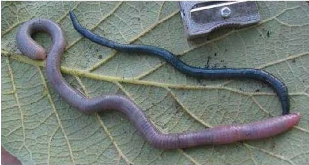
Figura 1. Dichogaster aff. eiseni (Csuzdi y Zicsi, 1991) (ejemplar superior, de color azul) y Zapotecia amecameca Eisen, 1900 (ejemplar inferior de color gris), recolectados en un bosque de pino-encino a 2 760 m de altitud (faldas del volcán Popocatepetl, Puebla). D. aff. eiseni es una especie epigea y pertenece a un género ampliamente distribuido en la Faja Volcánica Transmexicana (FVT). Z. amecameca es una especie hipogea cuyo género es común en los bosques templados y fríos de la parte central y este de la FVT (Cervantes, 2010, 2012).