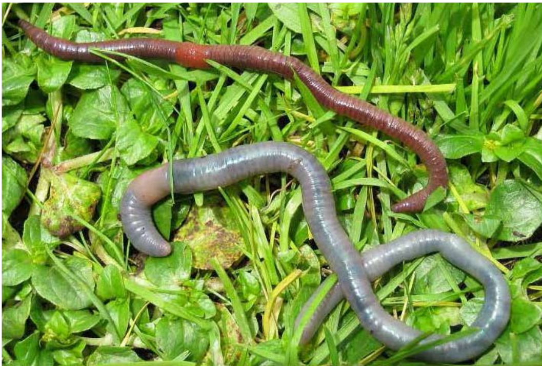
Figura 2. Lumbricus rubellus Hoffmeister, 1843 (ejemplar superior de color rojizo) y Eutriggeria lineri (Righi, 1972) (ejemplar inferior de color gris), recolectados en el Parque Nacional Nevado de Toluca (Estado de México) a 3 520 m snm. L. rubellus es una lombriz epigea exótica, originaria de Europa y ampliamente distribuida en los bosques de pino-encino de México y muchos otros países. E. lineri es una lombriz hipogea nativa, endémica de los bosques de encinos del Nevado de Toluca y alrededores.