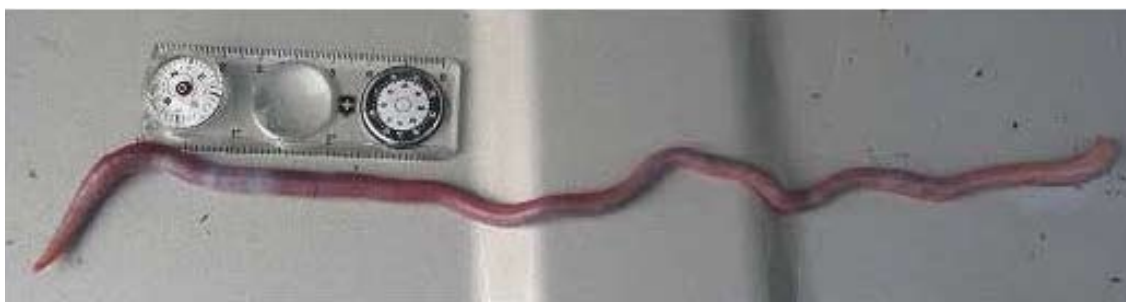
Figura 4. Lavelloodrillus sp. recolectada en un acahual húmedo, cerca de Catazajá (Chiapas) a 30 m snsm. El género Lavelloodrillus es endémico de los estados de Chiapas y Tabasco y muy común en selvas tropicales, acahuales y pastizales húmedos.