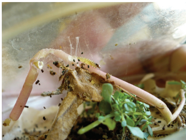
Figura 2. Larvas de Herpetogramma bipunctalis alimentándose de Alternanthera philoxeroides .

en el trabajo de Allyson (1984). La etapa de crisálida tuvo una duración de 10-11 días (22-31/10/2012), luego llegó a la etapa de adulto (Fig. 3), con la cual se corroboró la determinación taxonómica de H. bipunctalis , utilizando las claves del género para Norteamérica (Solis, 2010).