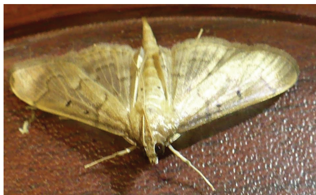
Figura 3. Adulto de Herpetogramma bipunctalis obtenido en laboratorio.

El periodo de desarrollo de las larvas fue de 22 días (1-22/10/2012), éstas fueron clasificadas como Lepidoptera: Pyraloidea: Crambidae: Pyraustinae: Spilomelini: Herpetogramma bipunctalis Fabricius (1794), con base